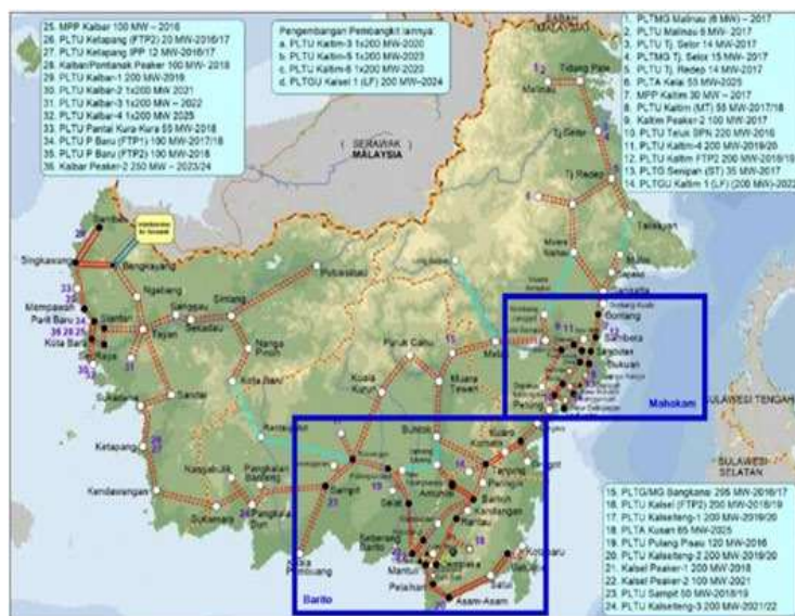
Gambar 3. Infrastruktur kelistrikan Kalimantan