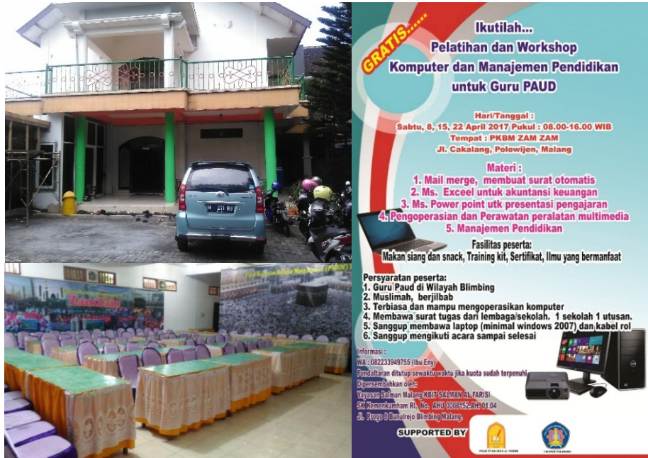
Gambar 3. Tempat dan brosur pelatihan

Penyiapan brosur/undangan dilakukan dengan membuat brosur/informasi kegiatan pelatihan komputer dan multimedia kepada Guru PAUD yang disebar secara langsung maupun melalui grup Whatsapp (WA) Himpaudi Blimbing. Persiapan tempat dan brosur pelatihan sebagaimana Gambar 3.