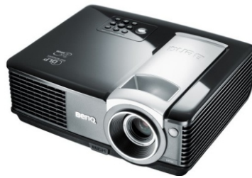
Gambar 1. LCD Projector

Adapun metode pelaksanaan dalam kegiatan PkM ini diilustrasikan pada diagram alir sebagaimana Gambar 2.