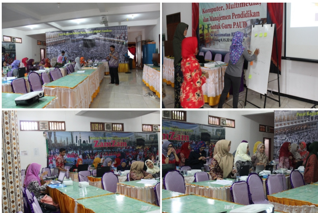
Gambar 5. Dokumentasi kegiatan pelatihan