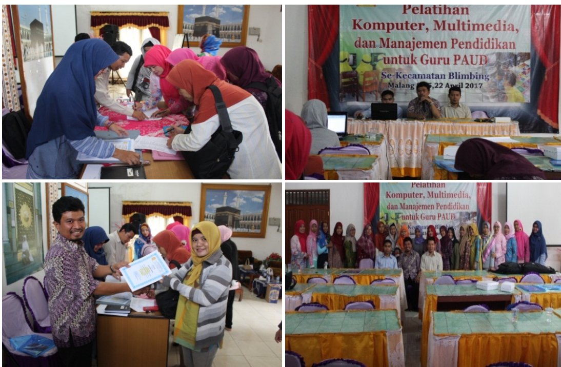
Gambar 6. Upacara penutupan dan penyerahan sertifikat pelatihan

Pada bagian akhir pelatihan komputer multimedia yang diselenggarakan oleh tim PkM Jurusan Teknik Mesin Polinema ini dilakukan penutupan acara. Upacara penutupan dilakukan secara sederhana, dengan kegiatan Sambutan dan ucapan terimakasih dari ketua panitia kegiatan, penyampaian kesan dan pesan dari peserta, serta doa penutup. Setelah itu dilanjutkan dengan sesi foto bersama dan pengambilan sertifikat pelatihan oleh peserta. Upacara penutupan dan penyerahan sertifikat pelatihan sebagaimana Gambar 6.