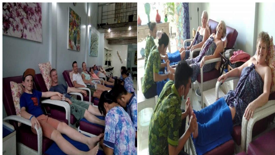
Gambar 1. Postur kerja Karyawan Y Spa

Berdasarkan Tabel 4 ditemukan bahwa hasil uji t-paired terhadap keluhan muskuloskeletal dan kelelahan karyawan Y Spa sebelum bekerja dan setelah bekerja tidak berbeda bermakna ( p > 0,05 ). Terjadi peningkatan skor keluhan musculoskeletal setelah bekerja sebesar 86,4% dan skor kelelahan meningkat 95%. Keluhan ini diperkirakan terjadi karena postur kerja membungkuk yang dilakukan dalam waktu lama dan terus menerus.