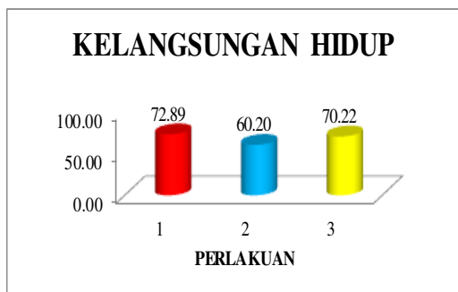
Gambar 3. Kelangsungan Hidup Udang Galah ( Macrobrachium rosenbergii de Man 1879).

Hasil pengamatan kelangsungan hidup Udang Galah ( Macrobrachium rosenbergii de Man 1879) pada masing-masing perlakuan terdapat pada Gambar 3