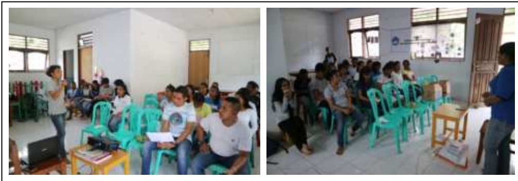
Gambar 2. Kegiatan Penyuluhan Pengenalan Jenis Teripang Bernilai Ekonomis Penting

Kegiatan pengenalan jenis teripang bernilai ekonomis penting dimaksudkan untuk mengenalkan kepada masyarakat jenis teripang yang memiliki nilai ekonomis penting (Gambar 2). Kegiatan pengenalan jenis teripang di perairan pantai Suli ini sekaligus merupakan bentuk diseminasi hasil penelitian dari Manuputty dan Pattinasarany (2017) kepada masyarakat Desa Suli, sehingga selain jenis yang diperkenalkan kepada masyarakat, juga diinformasikan mengenai nilai potensi masing-masing jenis yang ditemukan, agar masyarakat dapat memahami kondisi teripang pada perairan tersebut.