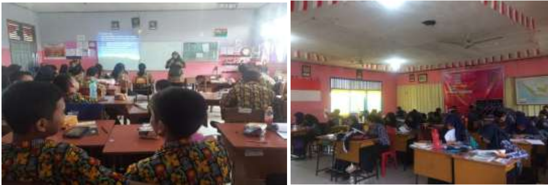
Gambar 1. Pelaksanaan Kegiatan Pengabdian