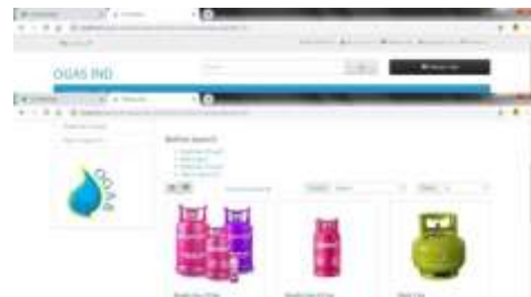
Gambar 4.Desain Menu