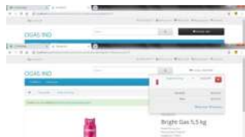
Gambar 5.Desain Menu