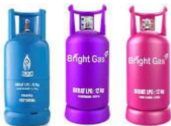
Gambar 1. O Gas

Semakin berkembangnya gas elpiji membuat pekerjaan semakin banyak dan juga memakan waktu lama dalam proses pendataan pelanggan, pendataan gas elpiji, transaksi penjualan, pengembalian dan sebagainya. Jika menambah karyawan maka akan semakin banyak koordinasi dan memakan biaya yang cukup banyak. Untuk menghemat biaya dan untuk mengefisiensi waktu dalam perkembangan perusahaan kedepan maka dirancang sistem informasi yang dapat mengatasi permasalahan-permasalahan yang terjadi.