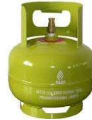
Gambar 3. Tabung Gas

keperluan rumah tangga yang akhir-akhir ini sulit untuk di beli. Pergi ke penjual 1, 2, bahkan lebih, sering kali tidak ada atau sudah habis. Apalagi harus membawa tabung yg cukup berat.