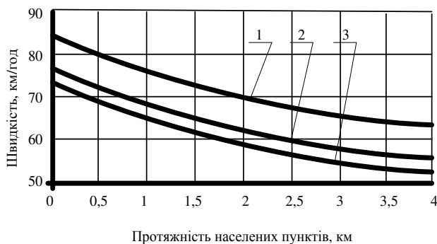
Рисунок 2 – Залежність швидкості руху в населених пунктах (з нещільною забудовою) від протяжності населеного пункту: 1 – швидкість легкових автомобілів; 2 – швидкість вантажних автомобілів; 3 – швидкість потоку автомобілів.

З рис. 2 встановлено, що якщо в населених пунктах протяжністю понад 2,5 км з щільною забудовою швидкість стабілізується, то при нещільній забудові зниження швидкості триває. Рух автомобілів в межах таких населених пунктів відбувається з підвищеними швидкостями. У цих населених пунктах, як правило, відсутній активний рух пішоходів. У населених пунктах з односторонньою забудовою вся увага водіїв спрямована на ту сторону дороги, де розташована забудова. В таких населених пунктах випадки перетину пішоходами проїзної частини рідкісні, а за наявності пішохідних доріжок руху, пішохідів на проїзній частині не спостерігається. Тому швидкість руху автомобілів вища, ніж при двосторонній забудові. При односторонній забудові на швидкість руху автомобілів впливає як віддалення забудови від проїзної частини, так і розташування її по відношенню до смуги проїзної частини, по якій рухаються автомобілі.