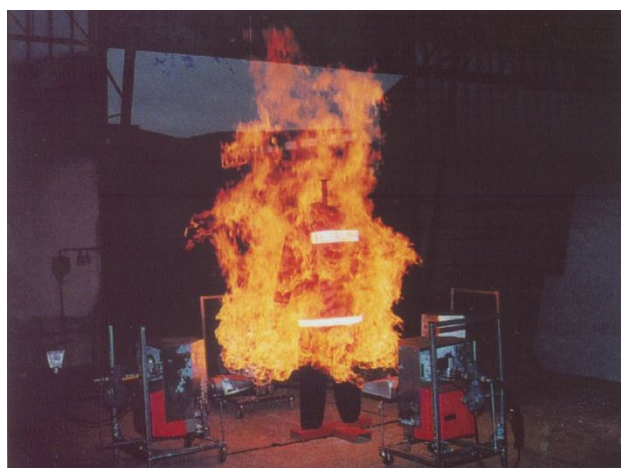
Рисунок 2 – Газові пальники, які використовуються для випробувань захисного одягу

Для того, щоб дослідити вплив одночасно конвекції, випромінювання та відкритого полум'я, використовують газові пальники (рис. 2).