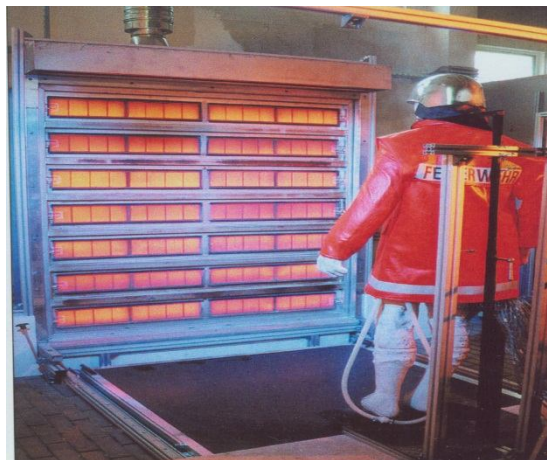
Рисунок 1 – Стенд теплових панелей, який використовується для випробування захисного одягу

Сутність дослідження полягає в тому, що в якості високотемпературного джерела використовуються тенти, потужність яких та густина теплового потоку регулюються з допомогою реостата.