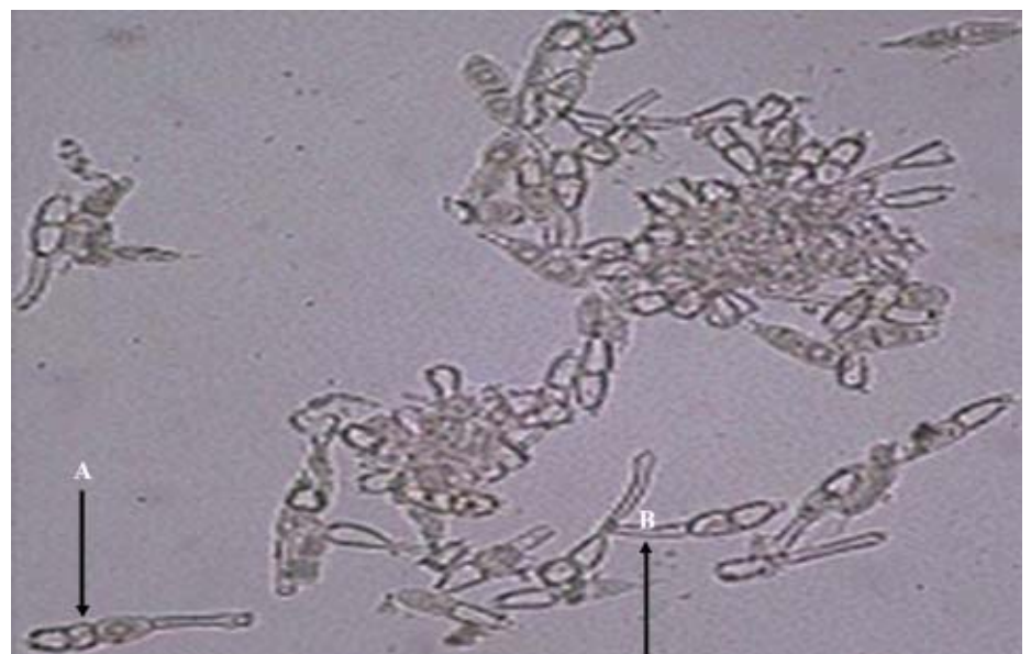
Gambar 1. Hialin teliospora dari Puccinia horiana (A) dan tangkai teliospora (B) (Szakuta dan Butrymowicz 2004).

P. horiana dilaporkan masuk ke Indonesia sekitar tahun 1990, diduga melalui bibit krisan impor yang tidak terdeteksi karena gejala penyakit belum