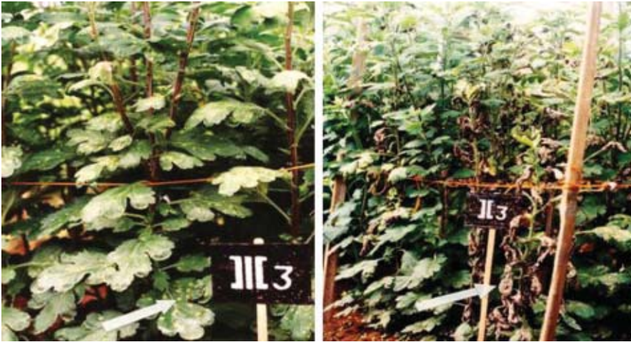
Gambar 2. Gejala awal dan gejala lanjut penyakit karat putih pada tanaman krisan (Hanudin et al. 2010).

muncul (Djatnika et al. 1994a). Fenomena demikian dapat terjadi pada patogen yang berinteraksi dengan tanaman yang menjadi inangnya. Selain melalui bibit, patogen dapat menular melalui angin, air, perlakuan pemeliharaan, pakaian pekerja, dan peralatan pertanian. Dengan cara demikian, penyakit karat putih menyebar dengan cepat ke lokasi pertanaman baru yang sebelumnya belum pernah ditanami krisan. Lebih kurang 28% bibit krisan yang diproduksi oleh petani telah terinfeksi oleh penyakit karat (Suhardi 2009a). Saat ini penyakit tersebut telah menyebar luas di seluruh sentra produksi krisan di Indonesia. Penggunaan benih sehat merupakan langkah strategis untuk mengurangi sumber inokulum penyakit karat putih.