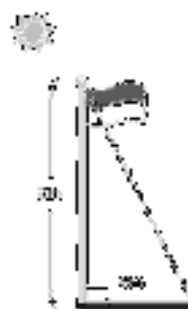
Gambar 2. Ilustrasi Masalah I

Sebuah tiang bendera mempunyai tinggi 8m dan membentuk bayangan sepanjang 6m sehingga terbentuk segitiga siku-siku seperti gambar 1. Seorang siswa akan mengukur jarak dari ujung bayangan ke puncak tiang bendera. Apabila terdapat tiga segitiga siku-siku yang sama seperti gambar 1 di atas, kemudian segitiga-