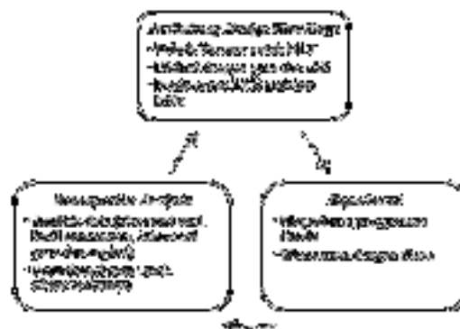
Gambar 1. Bagan Alur Design Research

Subjek dalam penelitian ini adalah siswa kelas VII salah satu Sekolah Menengah Pertama (SMP) yang berstatus negeri di Kota Cirebon. Siswa tersebut diberikan LKS berbasis aktivitas kritis yang sudah terlebih dahulu dirancang melalui pendekatan Design Research . Menurut Gravemeijer dan Cobb (2001 & 2006); Gravemeijer (2004); serta Cobb, dk (2003); Al Jupri (2008:9) Design research terdiri dari tiga fase, yaitu: preliminary design (fase desain awal), experiment (fase uji coba), dan retrospective analysis (fase retrospektif).