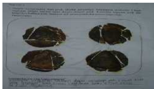
Gambar 1. Hasil Kerja Siswa pada LAS

Dalam kegiatan pembelajaran dengan menggunakan alat peraga konkret, siswa dapat mencari, menemukan, menentukan dan menarik kesimpulan bahwa rumus luas permukaan bola adalah L = 4\pi r^2 , sehingga melalui peragaan yang dilakukan sendiri oleh siswa, diharapkan dapat meningkatkan pemahaman siswa tentang konsep-konsep yang terdapat pada materi pembelajaran. Lebih jauh, siswa dapat mengingat untuk waktu yang lama apa yang telah didapatkannya melalui pembelajaran dengan menggunakan alat peraga konkret. Berikut ini adalah salah satu pekerjaan siswa dalam kegiatan pembelajaran di dalam kelas yang terdapat pada LAS: