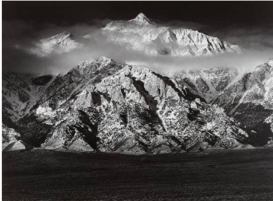
Gambar 2. Mount Williamson, Sierra Nevada, from the Owens Valley, California. 1944