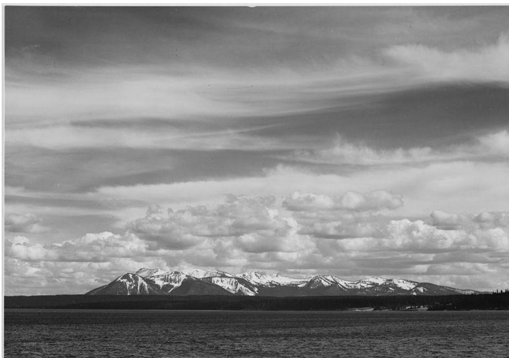
Gambar 1. Yellowstone Lake, Mount Sheridan, Yellowstone National Park, Wyoming

Pada tahun 1933 Ansel Adam pergi ke New York dan bertemu Alfred Stieglitz seorang fotografer senior, dan mereka berpameran bersama dengan menunjukkan 45 hasil foto yang menakjubkan. Tahun 1938 Adam juga memproduksi sebuah buku “Sierra Nevada: The John Muir Trail. Ia kembali ke gunung yang dijelajahi John Muir pertengahan abad 19 sebagai tema utamanya tentang spiritualitas alam. Pada akhirnya buku ini membantu memenangkan status taman nasional sebagai Kings Canyon di tahun 1940. Salah satunya adalah foto danau Yellowstone, gunung Sheridan, Taman Nasional Yellowstone, Wyoming. Ansel Adam melihat elemen alam tersebut dianalogikan sebagai hubungan materi dan spriritual, suatu kemegahan, seperti hubungan mikro kosmos dan makrokosmos alam yang saling bersinergi membentuk kehidupan.