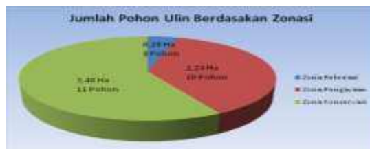
Gambar 4. Jumlah Pohon Ulin pada Plot Pengamatan berdasarkan Zonasi

pohon, pada zona koleksi/pengayaan sepanjang 2,24 Ha seluas 10 pohon dan zona konservasi seluas 3,48 Ha sebanyak 11 pohon. Untuk kehadiran jumlah individu pohon Ulin pada masing-masing zona dapat dilihat pada Gambar 4 di bawah: