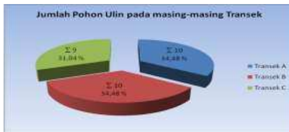
Gambar 3. Jumlah Pohon Ulin pada Plot Pengamatan setiap Transek

Pada transek A dan B ditemukan pohon Ulin masing-masing sebanyak 10 pohon Ulin sedangkan pada transek C ditemukan 9 pohon Ulin, sehingga total dari ketiga transek tersebut ditemukan 29 pohon. Untuk kehadiran jumlah individu pohon Ulin pada masing-masing transek dapat dilihat pada Gambar 3 di bawah: