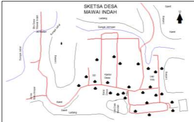
Gambar 1. Sketsa Desa Mawai Indah

Pada sketsa desa ini tergambar lokasi perkebunan/pertanian mengelilingi perkampungan. Desa Mawai Indah mempunyai sungai yang cukup besar untuk menjamin ketersediaan air namun sering terjadinya banjir akibat tingginya debit air sungai. Desa juga mempunyai cekdam bendungan pengendali untuk pengendalian banjir namun sepertinya belum berhasil dalam mengatasi terjadinya banjir.