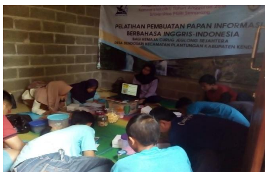
Gb 3. Praktik Menggambar Papan Informasi

Sesi berikutnya adalah praktik atas materi pertama. Remaja mempraktikkan membuat informasi menggunakan ekspresi yang telah mereka pahami secara individu. Praktik pertama ini dilakukan dengan membuat atau menggambar informasi menggunakan kertas gambar. Luaran yang didapat dari kegiatan ini adalah selain mereka semakin memahami ekspresi-ekspresi yang digunakan di papan informasi, mereka juga masing-masing berkreasi menghasilkan berbagai model papan informasi.