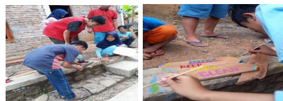
Gb 5. Praktik Membuat Papan Informasi

Setelah praktik menggambar papan informasi di kertas gambar secara individu, kemudian remaja mempraktikkan secara langsung membuat papan informasi menggunakan papan atau kayu beserta cat yang sudah disediakan. Mereka membuat papan informasi secara berkelompok. Dalam kegiatan praktik 2 ini terbentuk empat kelompok dan masing-masing kelompok membuat papan informasi secara berbeda. Luaran dari kegiatan ini adalah terciptanya papan-papan informasi berbahasa Inggris dan Indonesia. Berikut foto-foto kegiatan Pelatihan Pembuatan Papan Informasi Berbahasa Inggris-Indonesia.