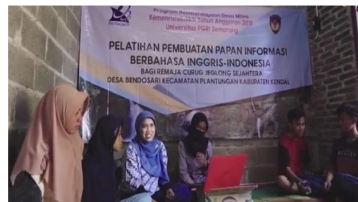
Gb 1. Penyampaian Materi tentang Pentingnya Papan Informasi

lain. Tujuan dari sesi kedua ini adalah untuk memberikan pengetahuan kepada remaja akan ungkapan-ungkapan yang benar yang digunakan dalam papan informasi yang ada di lokasi wisata. Metode yang digunakan pada sesi kedua, yaitu ceramah dan tanya jawab. Sebelumnya remaja hanya mengetahui beberapa ungkapan saja yang berbahasa Indonesia, dan mereka tidak memahami ungkapan yang digunakan di papan informasi berbahasa Inggris. Namun, setelah diberikan materi, pemahaman remaja akan ungkapan-ungkapan Bahasa Inggris dan Indonesia yang digunakan dalam papan informasi baik berbahasa Inggris maupun Indonesia di lokasi wisata meningkat. Peningkatan pemahaman remaja ini diukur secara kualitatif yang dilakukan dengan memberikan kesempatan bagi remaja setempat untuk menjelaskan ulang ungkapan-ungkapan Bahasa Inggris dan Bahasa Indonesia.