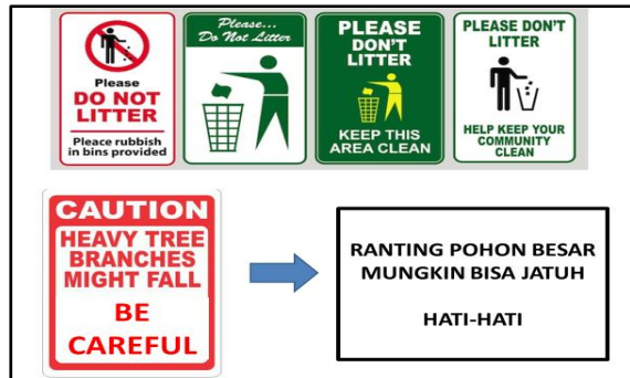
Gb 2. Contoh Papan Informasi

Sesi berikutnya adalah praktik atas materi pertama. Remaja mempraktikkan membuat informasi menggunakan ekspresi yang telah mereka pahami secara individu. Praktik pertama ini dilakukan dengan membuat atau menggambar informasi menggunakan kertas gambar. Luaran yang didapat dari kegiatan ini adalah selain mereka semakin memahami ekspresi-ekspresi yang digunakan di papan informasi, mereka juga masing-masing berkreasi menghasilkan berbagai model papan informasi.