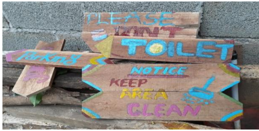
Gb 6. Hasil Praktik

Kegiatan selanjutnya setelah pelatihan pembuatan papan informasi berbahasa Inggris dan Indonesia adalah pendampingan. Pendampingan secara berkala dilakukan agar hasil dari pelatihan dapat secara terus menerus diterapkan oleh remaja. Pembuatan papan informasi selanjutnya dilakukan sesuai dengan kebutuhan di lokasi wisata.