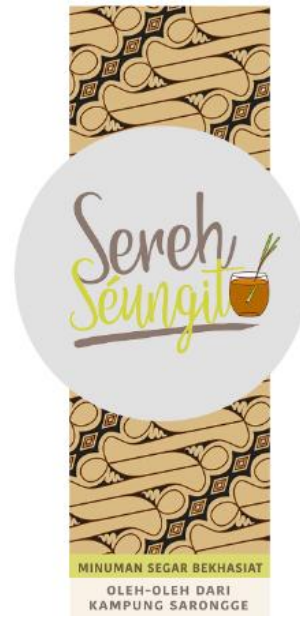
Gambar 3. Desain logo dan label alternatif 2

Desain logo dan label pada gambar di atas yang nantinya digunakan di semua kemasan teh “sereh seungit”.