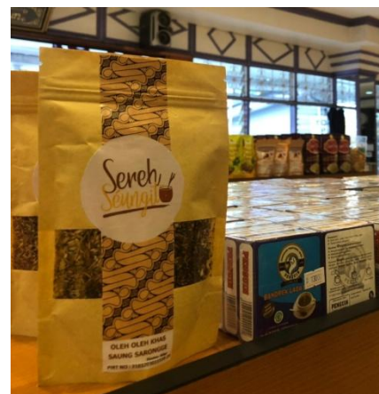
Gambar 10. Display produk di Toko Okeke