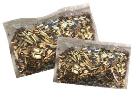
Gambar 4. Kemasan awal teh sereh

plastik biasa dan dikemas secara sachet (gambar 4).