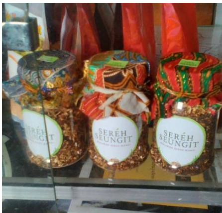
Gambar 7. Teh sereh kemasan toples special edition

Kemasan khusus lainnya didesain dengan format berbeda, yakni kemasan toples. Kali ini kami memanfaatkan teknologi untuk memesan kemasan secara online. Kemasan toples berisi 60 gram teh sereh dan dipercantik dengan kain perca yang dililit dengan kain perca pula. Toples disempurnakan dengan penempelan stiker dan label (Gambar 7).