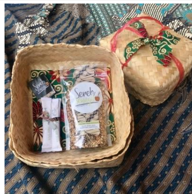
Gambar 5. Teh sereh kemasan “besek” special edition

Keterbatasan Desa Ciputri yang jauh dari supplier kemasan, tidak menyurutkan kreativitas mitra dan tim builder untuk memanfaatkan bahan yang ada di pasar terdekat. Dengan menggunakan besek yang dapat diperoleh di pasar, sedikit kain perca yang berasal dari limbah penjahit, dan pita kami dapat mengkreasikan kemasan yang terkesan vintage namun menarik (gambar 5).