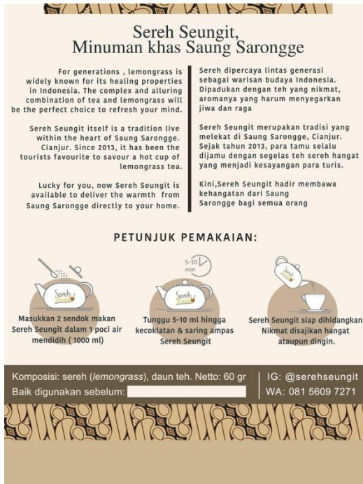
Gambar 6. Label kemasan yang berisi informasi produk

Kemasan khusus lainnya didesain dengan format berbeda, yakni kemasan toples. Kali ini kami memanfaatkan teknologi untuk memesan kemasan secara online. Kemasan toples berisi 60 gram teh sereh dan dipercantik dengan kain perca yang dililit dengan kain perca pula. Toples disempurnakan dengan penempelan stiker dan label (Gambar 7).