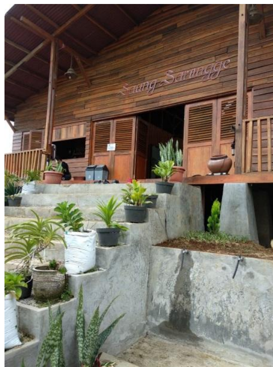
Gambar 1. Saung Sarongge sebagai tempat singgah wisatawan

datang mendapatkan welcome drink berupa teh sereh buatan tangan Bu Ijah sendiri. Setelah meminum welcome drink, pengunjung selalu bertanya apakah teh sereh buatan Bu Ijah tersebut ada versi instannya sehingga bisa dibawa pulang sebagai buah tangan. Berangkat dari permintaan para wisatawan tersebut, Bu Ijah tergerak untuk mengembangkan teh sereh instan.