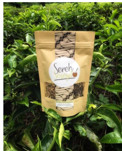
Gambar 8. Teh sereh kemasan paper pouch

Desain kemasan regular kami peruntukkan untuk di-display di Saung Sarongge dan toko oleh-oleh incaran mitra. Kami memilih kemasan paper pouch ditambah silica gel untuk mencegah lembab (Gambar 8). Paper pouch ini juga kami dapatkan secara online. Kemasan paper pouch dipilih untuk kemasan regular karena kualitas bahan yang sangat baik dan harga yang relatif terjangkau. Selain itu, kemasan paper pouch memiliki kesan mewah dan kekinian sehingga dapat meningkatkan daya tarik dan nilai jual produk. Paper pouch ini merupakan standing paper pouch untuk memudahkan display produk dan dilengkapi dengan ziplock untuk memudahkan buka tutup secara langsung. Ziplock ini juga diperuntukkan guna menjaga kualitas produk teh sereh. Kemasan ini berisi 60 gram teh sereh dan berukuran 120 x 200 mm.