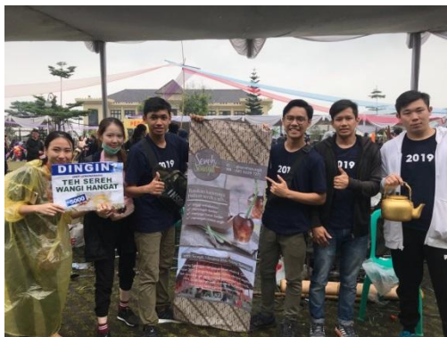
Gambar 14. Tim builder pendamping mitra