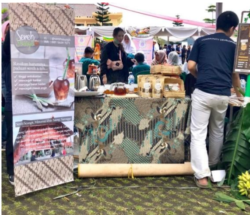
Gambar 13. Keikutsertaan mitra dalam bazaar “Saung Rahayat” di Cianjur

besek. Sedangkan dalam kemasan besek diproduksi sebanyak 15 kemasan namun hanya terjual 6 kemasan dengan target 15 kemasan terjual. Hasil penjualan mengindikasikan bahwa jenis kemasan paper pouch memiliki penjualan yang lebih banyak dibanding dengan kemasan besek. Dari data tersebut pula, dapat disimpulkan bahwa walaupun kemasan besek lebih memiliki citra tradisional namun konsumen tetap lebih menyukai kemasan regular kekinian (paper pouch) karena lebih efisien untuk dibawa.