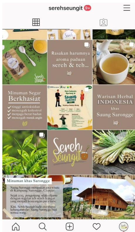
Gambar 12. Laman instagram teh “sereh seungit”