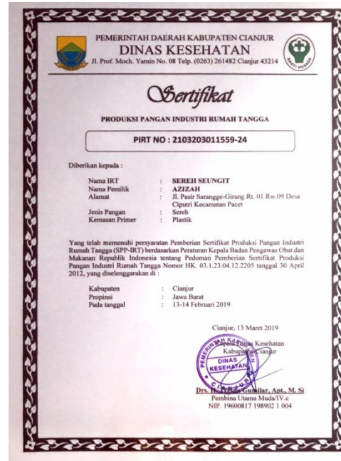
Gambar 9. Sertifikat PIRT dari Dinas Kesehatan

Terbitnya nomor PIRT ini membuat tim kami bergerak cepat untuk melakukan konsinyasi dengan beberapa toko oleh-oleh di Desa Ciputri. Sampai saat ini kami baru berhasil menitipkan produk “sereh seungit” di toko oleh-oleh “Roti Unyil & Kue Okeke” yang beralamat di Jl. Raya Cipanas No.8, Cipendawa, Kec. Pacet, Kabupaten Cianjur.