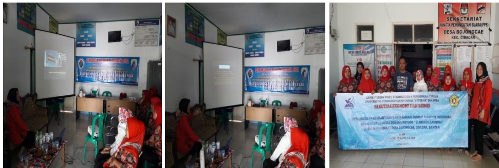
Gambar 1. Tim Pengabdian Sedang Memberikan Pengenalan dan Pelatihan Metode Pembelajaran Blended Learning dan Media Online

Akun ayokita.belajar sangat bermanfaat untuk memberikan ilmu kepada orang lain, tidak hanya untuk masyarakat desa bojongcae namun untuk semua masyarakat yang mengikuti akun tersebut dan menyukai materi-materi yang telah di upload . Berikut merupakan gambar dari kegiatan pembelajaran yang dilakukan dengan kelompok mitra dan entuk materi yang disampaikan.