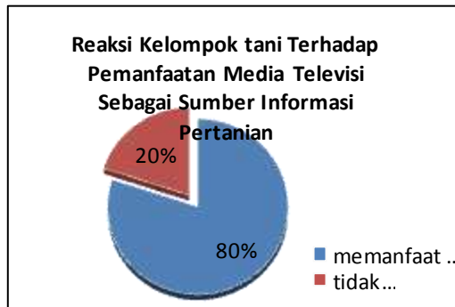
Gambar 3. Diagram Reaksi Kelompok tani

Reaksi tertarik memanfaatkan televisi sebagai sumber informasi pertanian sebanyak 32 responden (80%). Reaksi ini muncul disebabkan adanya kemudahan untuk mendapatkan informasi melalui media televisi dibandingkan media lain. Televisi menampilkan suara dan gambar sehingga dapat membantu di dalam memahami informasi baik itu responden yang tidak buta huruf maupun yang mengalami buta huruf. Informasi tersebut dapat digunakan sebagai bahan diskusi baik itu dengan sesama petani, kelompok, maupun kepada penyuluh. Dengan informasi tambahan, petani dapat menjadi lebih aktif dalam penyuluhan dan memiliki pengetahuan inovasi terbaru sehingga membantu usahataniannya.