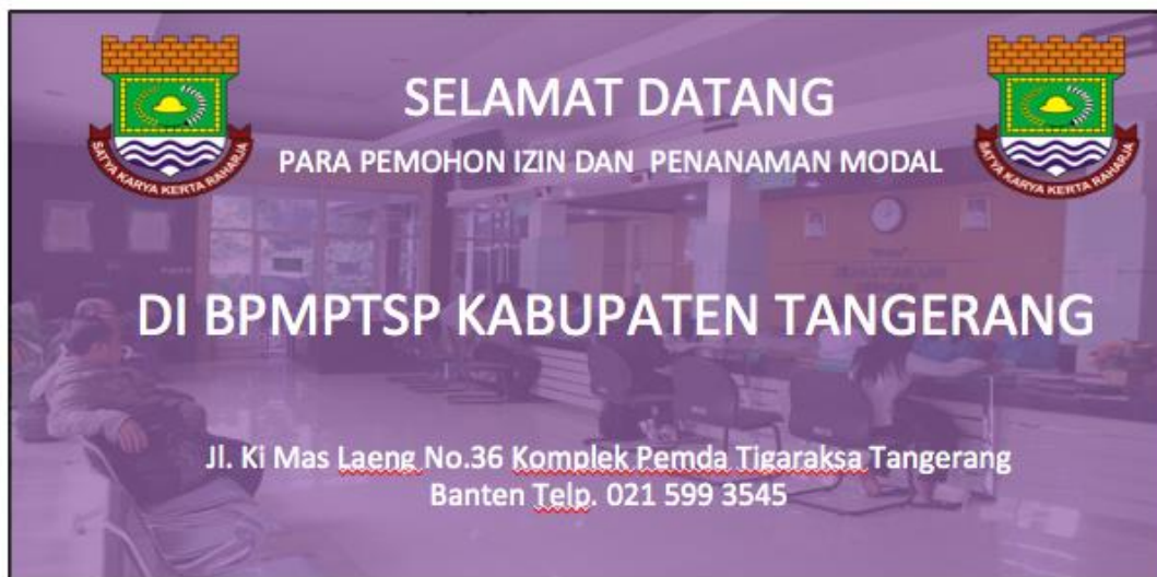
Gambar 3. Desain Spanduk Badan Pelayanan Modal dan Terpadu