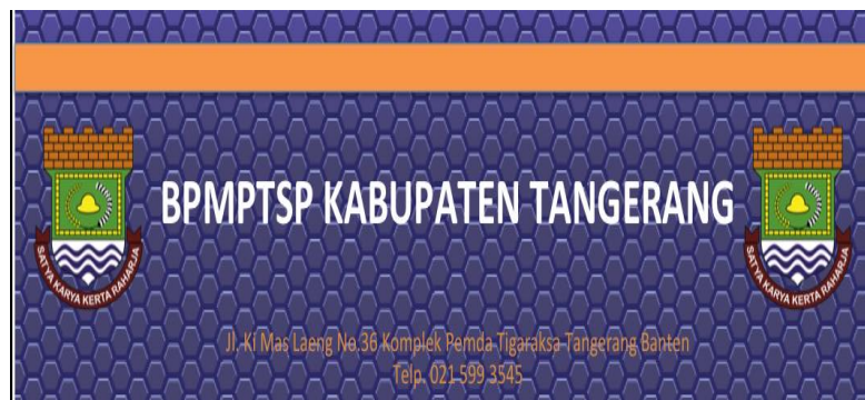
Gambar 6. Desain Media Baiho Badan Pelayanan Modal dan Terpadu.