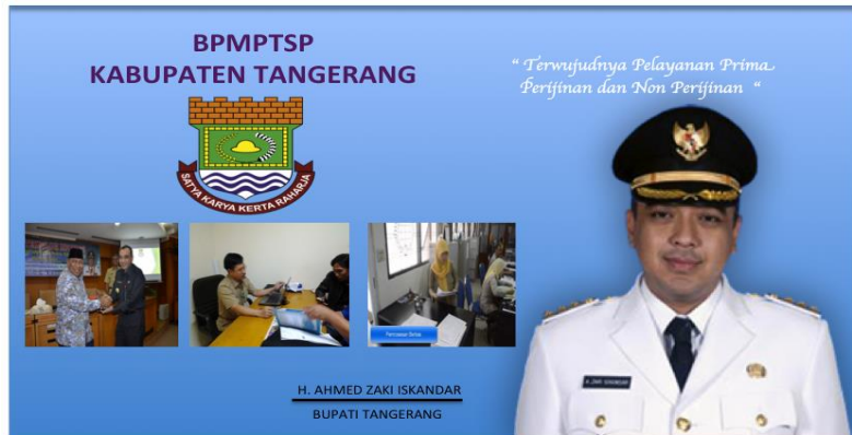
Gambar 5. Desain Media Baiho Badan Pelayanan Modal dan Terpadu.