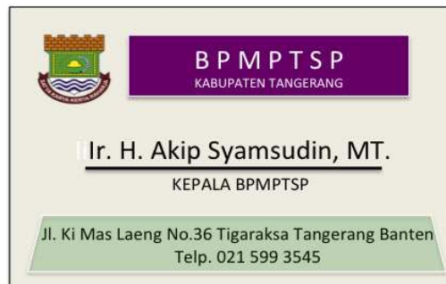
Gambar 3. Desain Kartu Nama Badan Pelayanan Modal dan Terpadu