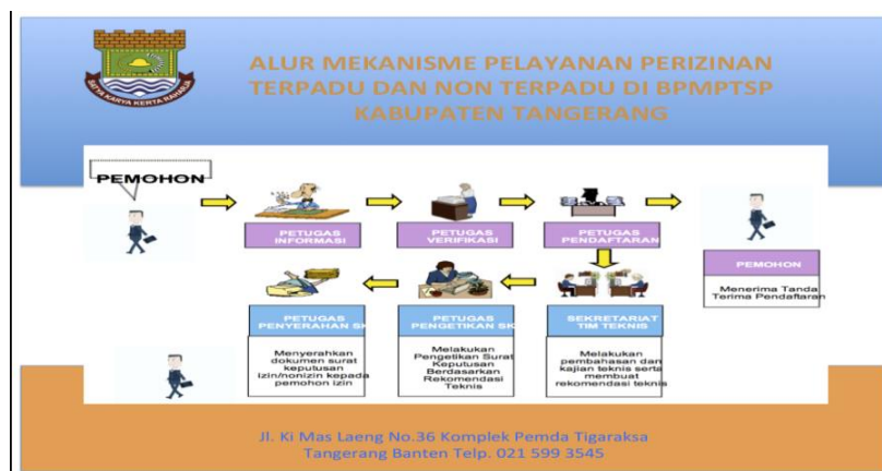
Gambar 6. Desain Banner Alur Mekanisme Badan Pelayanan Modal dan Terpadu