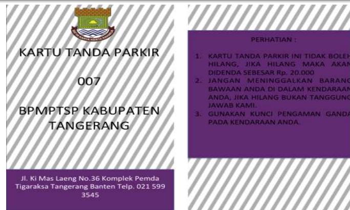
Gambar 7. Desain Kartu Parkir Perizinan Badan Pelayanan Modal dan Terpadu