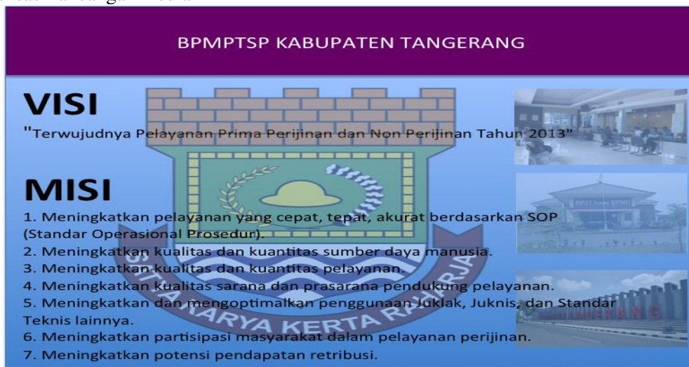
Gambar 4. Desain Banner Visi dan Misi Badan Pelayanan Modal dan Terpadu