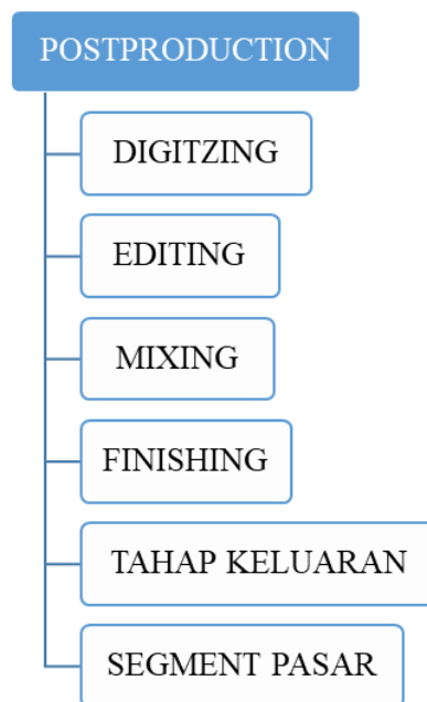
Gambar 3. Post Produksi

Post Produksi atau pasca produksi adalah langkah akhir yang menggunakan editing dan editing tersebut menggunakan aplikasi agar editing suatu video hasilnya akan rapih dan bagus.