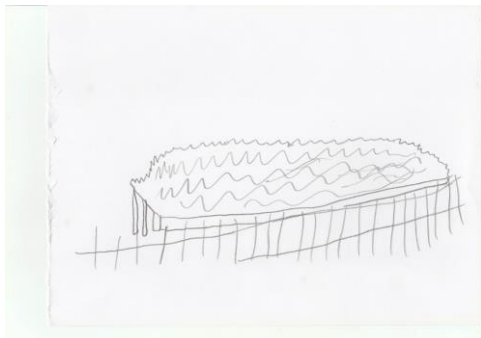
Gambar 9. Menampilkan Video Farming dan Gardening