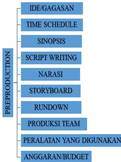
Gambar 4.1. Preproduction

Langkah awal untuk mulai membuat suatau karya audio visual, memiliki tahapan-tahapan yang harus dilakukan diantaranya :