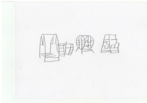
Gambar 8. Menampilkan Video Play Ground