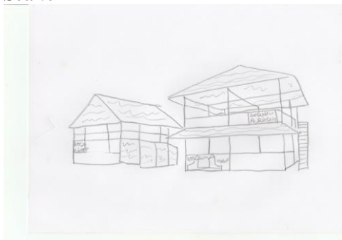
Gambar 10. Menampilkan Video Gedung Keseluruhan Sekolah