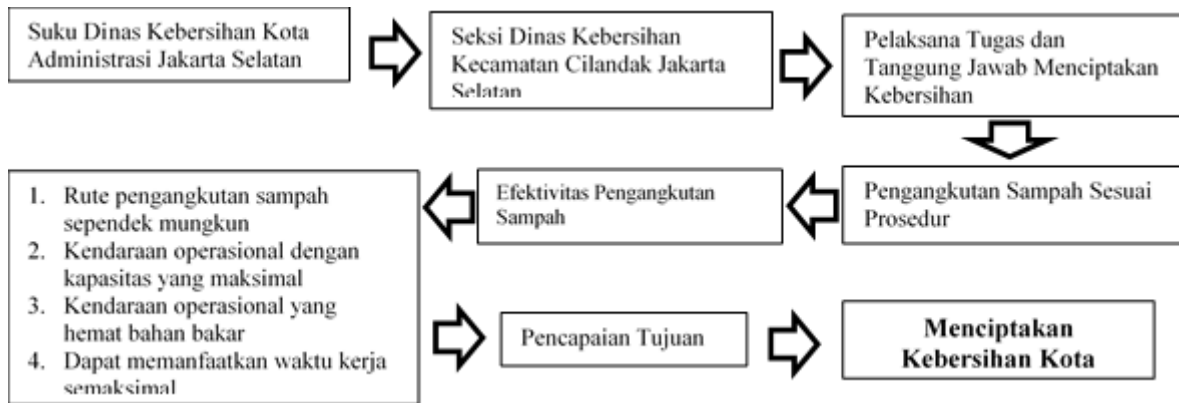
Gambar 1 Kerangka pemikiran

kerangka pemikiran dalam penelitian ini dapat digambar pada gambar berikut ini: