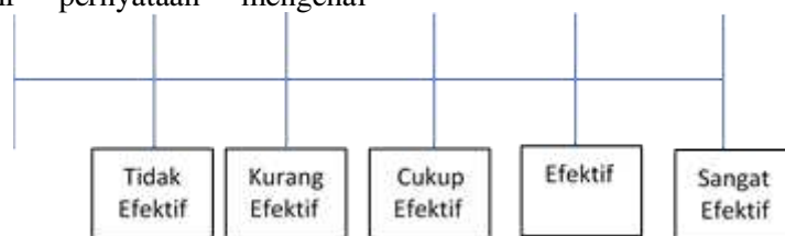
Gambar 2 Skala likert tingkat gradasi