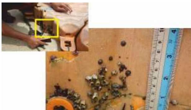
Gambar. 5. Penempelan Teritip pada bekas ponton dock di Pantai Mutun

Teritip yang ditemukan Teritip jenis M. withersii yang ditemukan di Pantai Mutun menempel banyak hanya pada bekas ponton dock yang telah lama tidak digunakan dan keberadaannya berkompetisi dengan A. amphitrute (gambar 5). Namun, pada akhir bulan November 2018, ponton dock tersebut dibersihkan dari area Pantai Mutun. A. amphitrute ditemukan melimpah dan menempel di tiang beton dan semen yang ada di pantai.