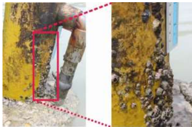
Gambar. 2. Penempelan Teritip pada Tiang Besi di Pantai Sariringgung

pada bagian keras berupa cangkang ( parietas ) dan plat penutup cangkang ( opercular plat ). Identifikasi spesies teritip menggunakan buku identifikasi Darwin, 1851 & 1954; Chan, 2006; Hagner & Vezo, 2006; Chan et al. , 2009; Yamaguchi et al. , 2009; Shahdadi & Sari 2010; Wijayanti et al. , 2010; Prabowo et al. , 2011; Reis et al. , 2011; Tsang et al. , 2012; Shahdadi et al. , 2014.