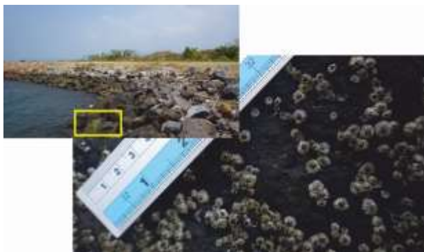
Gambar. 4. Penempelan Teritip pada batu penahan ombak di Teluk Kunit

Teritip yang ditemukan di daerah Teluk Kunit merupakan jenis teritip C. malayensis yang umumnya menempati daerah tertinggi pada mid upper shores pada substrat keras dan toleran terhadap sinar matahari kuat dengan suhu mencapai 45° (Wethey, 2002) serta tersebar luas di Samudera Hindia, perairan Indo-Malayan dan pantai-pantai tropis Australia (Southward dan Newman, 2003). Daerah sekitar Teluk Kunit merupakan daerah bebatuan penahan ombak (gambar 4), yang langsung terpapar oleh panas matahari, sehingga memungkinkan genus Chthamalus dominan dijumpai pada daerah tersebut.