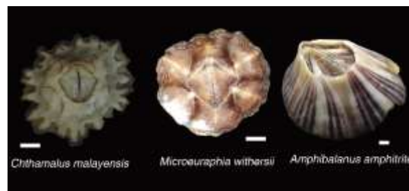
Gambar. 3. Tiga spesies yang tercatat ditemukan di Teluk Kuntit, Pantai Mutun dan Pantai Sariringgung. Bar=1 mm

Data teritip dewasa yang diperoleh dari infrastruktur yang terdapat di ketiga lokasi yang berada di Teluk Lampung menunjukkan sangat rendahnya biodiversitas teritip, terdiri dari Familia Balanidae ( Amphibalanus amphitrite ) dan Chthamalidae ( Chthamalus malayensis dan Microauraphia withersii ) (Gambar 3). Teritip jenis C. malayensis hanya ditemukan di lokasi Teluk Kuntit, sedangkan M. withersii dan A. amphitrite ditemukan di Pantai Mutun dan Pantai Sariringgung.