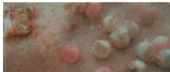
Gambar 3. Telur Pomacea canaliculata Lamarck yang mengalami plasmolisis dan robeknya cangkang.

Konsentrasi ekstrak biji A. catechu memberikan pengaruh pada kesintasan telur P. canaliculata . Rata-rata presentase mortalitas tertinggi diperoleh pada perlakuan P5 (100%) sedangkan presentase mortalitas terendah oleh perlakuan P0 (0%) terlihat pada Grafik 1. Hal ini diduga apabila ada penambahan konsentrasi maka kematian juga semakin bertambah dengan demikian semakin tinggi konsentrasi ekstrak biji A. catechu semakin tinggi pula kadar arecoline dan senyawa bioaktif lain yang larut didalamnya.