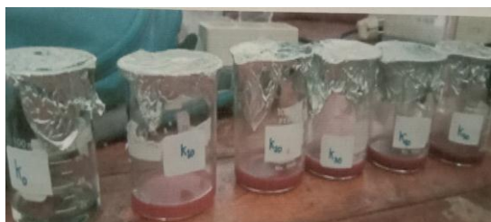
Gambar 1. Ekstrak biji Areca catechu L. dengan beberapa pengenceran.

Pemberian ekstrak biji A. catechu mengakibatkan telur tidak dapat menetas dikarenakan arekolin yang menghambat proses perkembangan di dalam telur sehingga tidak mampu lagi melaksanakan proses fisiologisnya, mengalami penurunan daya hidup serta penurunan kecepatan sintesis DNA, protein dan kerusakan enzim glutational yang berfungsi melindungi sel dari efek merugikan (Aradilla, 2009).