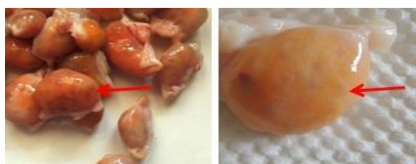
Gambar 1b. Folikel dan Ovarium sapi Bali Timor.

Penilaian terhadap kualitas oosit sebagai salah satu upaya melakukan seleksi terhadap oosit yang akan dimaturasi sangat mempengaruhi keberhasilan produksi embrio in vitro . Morfologi oosit berdasarkan kekompakan dan jumlah lapisan sel kumulus berakibat positif terhadap maturasi, fertilisasi dan pertumbuhan serta perkembangan embrio in vitro (de Wit et al. , 2000; Bilodeau Goeseels dan Panich, 2002). Tidak satu pun oosit gundul mampu mencapai embrio tahap 8-16 sel (Khurana dan Niemann, 2000).