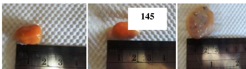
Gambar 1a. Pengukurarn ovarium sapi Bali Timor.

molekul lain yang mempengaruhi oosit dan perkembangan folikel