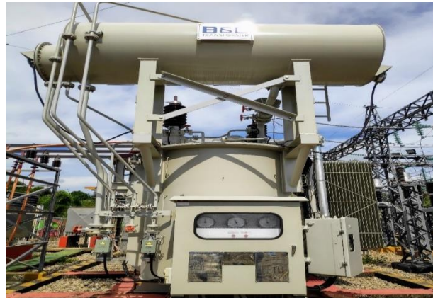
Gambar 4.2 Transformator 2