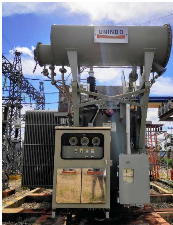
Gambar 4.1 Transformator 1

Merk : Unindo Serial Number : P030HE680-02 Year Of Manufactured : 2012 Power : 30 MVA Rated Voltage : 66/20 Cooling : ONAN/ONAF Frequency : 50 HZ Phases : 3 Position Of OLTC : 17 Tap Positions