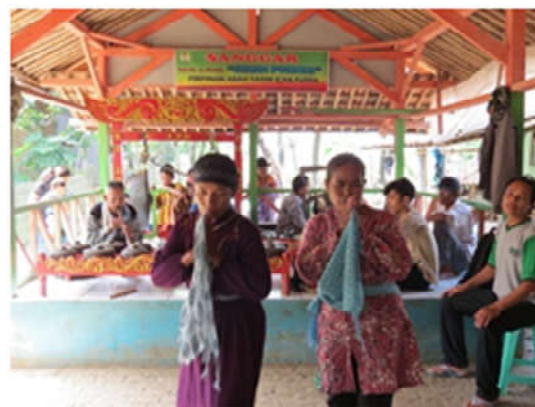
Gambar 2: Tarian soja yang ditarikan oleh penari sepuh

para pemain hanya berjalan mengikuti jalan Pendesaan, sementara untuk penyajian hiburan malam dibuat panggung ukuran 4x4 m dengan tinggi 2 meter dengan beratap terpal, yang menyambung dengan balandongan . Panggung yang dipergunakan para pengrawit ( nayaga ajeng ), yang tinggi fungsinya hanya diperuntukkan untuk para pemusik atau pengrawit ajeng ( nayaga ) saja, karena pada penyajian gamelan Ajeng tidak menyajikan pesinden ( juru kawih ), jadi hanya penyajian lagu-lagu isntrumetalia ( gending ) tanpa vokal ( sekaran ).