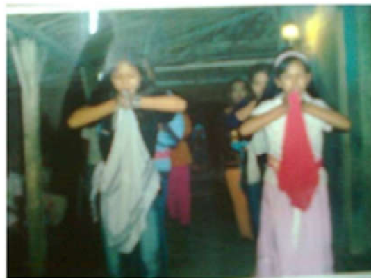
Gambar 5: Pelestarian Tari soja ditarikan remaja

mengiringi upacara pembukaan PORPROV 2006 Karawang. Maka pada saat itulah seni Ajeng mulai dilirik lagi oleh masyarakat, sehingga panggungan group seni Ajeng mulai berkembang lagi. Pada tahun 2006, group Ajeng yang tumbuh berkembang di Karawang, hanya tinggal 2 group, yaitu Sinar Pusaka dan group Ajeng Nyumplon Pagadungan Cikampek, tetapi dalam pelestariannya seni Ajeng Sinar Pusaka pimpinan Abah Tarim, mengalami perkembangan lebih dari group lainnya.