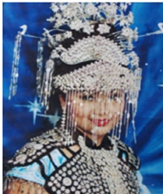
Gambar 3: Busana Pengantin khas Karawang

Dalam kajian pelestarian seni Ajeng, pada tahun 2006 upaya ini ditunjukkan oleh perhatian dinas terkait, yaitu Dinas Pariwisata Kabupaten Karawang. Adapun bentuk pelestariannya, yaitu dalam bentuk pembinaan kerja sama dengan program DISBUDPAR Jawa Barat. Dinas Pariwisata Karawang memohon 3 sarjana lulusan STSI dari 3 jurusan, yaitu tari, karawitan, dan teater untuk membina kesenian, yang ada di kabupaten Karawang. Pada tahun 2006, kegiatan pembinaan mulai berjalan, yang diawali dengan pembinaan 3 kesenian khas Karawang, yaitu Topeng Banjet, Seni Ajeng, dan Bajidoran. Pembinaan seni Ajeng Dusun Bambu Duri "Sinar pusaka" pimpinan Abah Tarim inilah, yang mulai dilestarikan oleh ketiga sarjana lulusan STSI Bandung. Pada pelestarian seni Ajeng, khususnya seni Ajeng Group Sinar Pusaka, langkah pelestarian, diawali dengan mengumpulkan seniman Ajeng di sanggar tersebut, kemudian bertukar pikiran, yang membicarakan masalah yang dihadapi seni Ajeng dan sanggarnya. Maka upaya pelestarian dilakukan dengan cara berlatih rutin dengan mengingat kembali pola tabuh dalam gending Tatalu , Gonjingan , Ela-ela , Salunan , Rancangan (Welasan Pelayon) , menurut Atik Soepandi (1982:71), gending