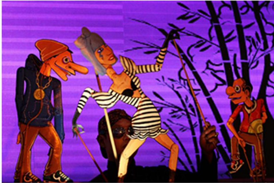
Gambar 5: Wayang Hip-hop , Patruk dan Gareng ketemu Lady Gaga

terhadap maraknya musik hip-hop di Yogyakarta, serta sebagai media pengenalan kembali seni pewayangan kepada generasi masa kini. Oleh sebab itu, pilihan panakawan termasuk Petruk sebagai tokoh yang divisualkan sesuai konteks kekinian cukup tepat, karena panakawan adalah ikon alam pikiran Jawa yang hidup sepanjang sejarah, dari jaman purba hingga Jawa modern. Panakawan ada dalam epik, mitos, ritual, hingga kehidupan nyata, sehingga tidak mengherankan jika dalam konteks seni pertunjukan mereka leluasa bertutur dengan bahasa Jawa, Indonesia, dan bahasa manca yang pernah menyinggahi Jawa.