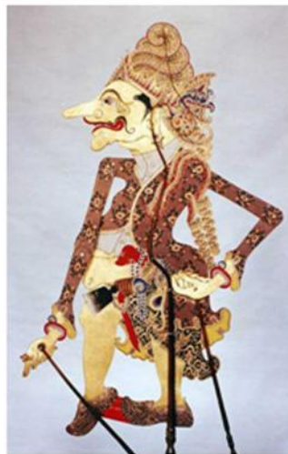
Gambar 3: Wayang Petruk menjadi pendeta/dukun