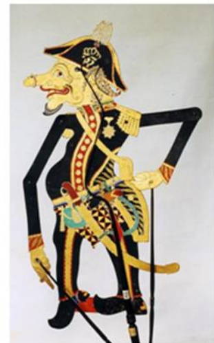
Gambar 4: Wayang Petruk menjadi kompeni http://javaneseart-culture.blog spot.com/2014/06/jenis-petruk-menurut-asal-daerahnya.html . Diunduh 5 Juli 2012