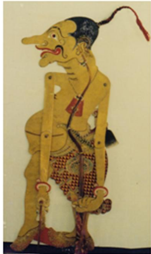
Gambar 1: Petruk Gaya Yogyakarta koleksi keraton Yogyakarta

Menurut Widyaseputra (Kuntara, 2009: 2), penggambaran yang serba panjang untuk menandakan bahwa Petruk adalah panjang sabar, panjang ilmu, panjang budi. Kucirnya yang panjang adalah kucir keramat, sehingga Arjuna pernah bertapa di kucir tersebut. Ketika Petruk lahir kucirnya berlumuran darah, kemudian dibersihkan dengan air liur burung Sendari Putih. Darah yang mengalir dari kucir menjadi senjata kapak yang dapat mewakili dirinya (lakon Resi Bandulan Jagad ). Hidung panjang melambangkan memiliki daya penciuman yang tinggi. Petruk mampu mendeteksi Bisma (bau bunga srigading), Janaka (bau bunga melati), dan Puntadewa berbau bunga gambir (lakon Seta Ngraman ). Telinga besar melambangkan kemampuan Petruk dalam membedakan yang asli dengan yang palsu melalui telinganya (lakon Gathutkaca Kembar ). Tangan depan menunjuk dengan dua jari artinya menunjuk hal ihwal ilahi dan duniawi, batin dan