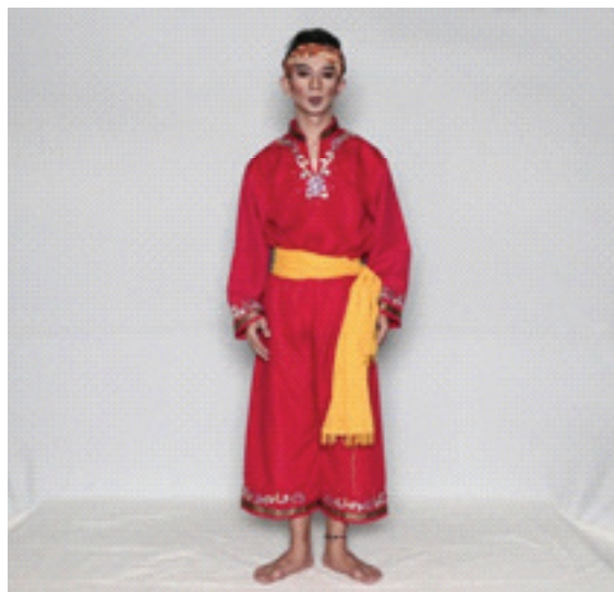
Gambar 2a. Rias dan Busana Putra (Dok: Tim Peneliti, 24 Mei 2019)