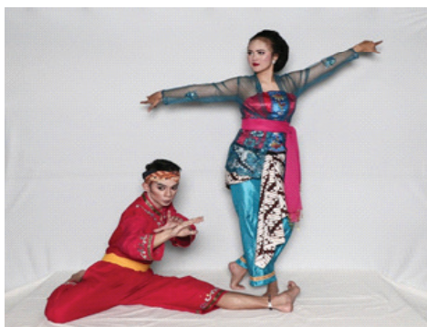
Gambar 1. Kesatuan gerak, rias, dan busana pada irama pencugan dalam réndéng bojong (Dok: Tim Peneliti, 24 Mei 2019)

Gending dimainkan berulang-ulang disesuaikan dengan kebutuhan gerak tari, dengan gamelan laras salendro dalam irama dua wilet/sawilet setengah. Adapun lagu yang digunakan dalam tarian réndéng bojong ini adalah lagu Banda Urang , sedangkan tepakan kendangnya memiliki dominasi yang kuat dalam mengiringi gerak tarinya. Pada umumnya dalam kelompok