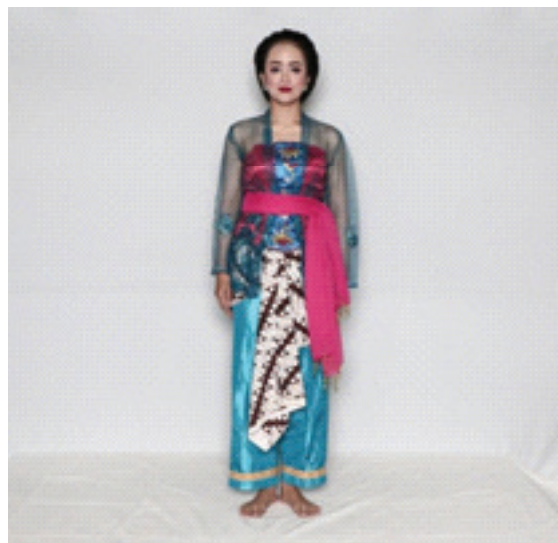
Gambar 2b. Rias dan Busana Putri

oleh penari putri juga nyaris sama dengan yang digunakan oleh ronggeng (rias keseharian), dilengkapi sanggul Sunda pada bagian kepala dengan asesorisnya.