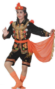
Gambar 1. Ragam gerak lambeyan tari dolalak tradisi