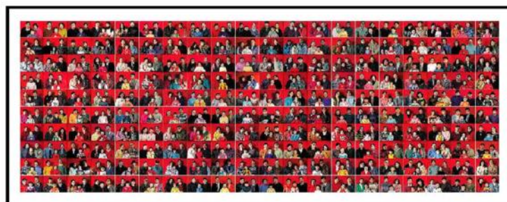
Gambar 1. "Standard Family", Wang Jinsong, installation: 116 color photographs (48 x 127 cm, 1996)