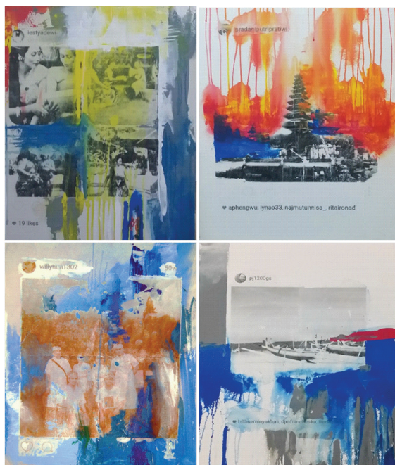
Gambar 5, Empat hasil karya Willy Himawan dengan memanfaatkan imaji Instagram tentang Bali, ukuran masing-masing 50x60 cm, media: imaji transfer inkjet , cat acrylic di atas kanvas, pembuatan: tahun 2015.

Lebih lanjut, hasil transfer imaji di atas kanvas direspon kembali menggunakan media konvensional yang lazim digunakan pada media kanvas, seperti cat. Hal ini dilakukan untuk mereduksi situs yang disebut Rose (2001) sebagai sites of production . Tentu saja, pada awalnya imaji-imaji yang didapatkan dari Instagram, situs produksinya dimiliki oleh masing-masing pemilik akun Instagram. Setelah teknik transfer imaji pada kanvas dilakukan, tentu saja sites of production berpindah dari pemilik akun Instagram ke seniman pembuat karya, namun situs-situs lainnya seperti situs imajinya sendiri dan konteks sosialnya masih membawa situs imaji yang dimiliki oleh imaji-imaji Instagram tersebut. Dengan de-