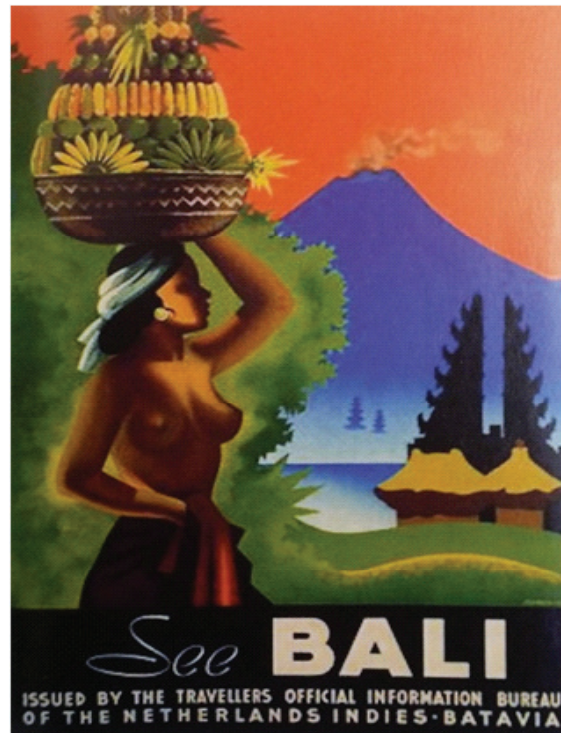
Gambar 2, poster tentang Bali di tahun 1930an

Seperti telah dipaparkan sebelumnya, dapat dikatakan bahwa imaji akan Bali telah terkonstruksi oleh konteks sosial di mana pariwisata menjadi pokok pentingnya. Pariwisata yang mendasarkan diri pada komersialisasi sejak tahun 1930an telah menampilkan imaji-imaji dalam konteks komersialisasi.