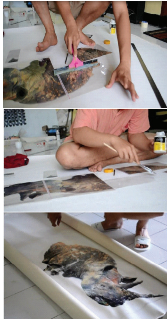
Gambar 4, contoh proses aplikasi transfer imaji - image transfer , hasil cetak printer inkjet pada kanvas. Proses penempelan imaji, penekanan dan pengeringan. (sumber : dokumentasi penulis, Himawan 2016)

Artikel ini pada dasarnya adalah suatu paparan pendekatan terhadap pemanfaatan imaji dalam proses berkarya seni rupa. Imaji-imaji tentang Bali yang ada pada 'dunia' Instagram, dalam pandangan Rose (2001), memiliki modalitas sosial yang dapat menggambarkan keberadaan imaji-imaji tersebut dalam konteks jaman terkini. Seperti yang telah dikemukakan Rose (2001) bahwa perkembangan teknologi adalah suatu modal yang diperhatikan dalam menginterpretasi imaji. Perkembangan media sosial di era informasi merupakan bagian dari