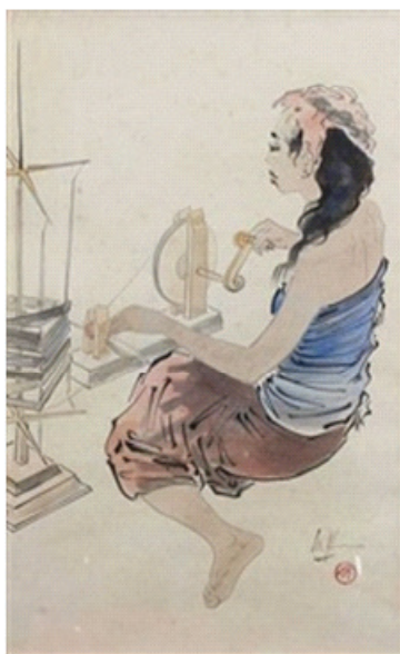
Gambar 3. Lee Man Fong, Wanita Menenun, 53 cm x 36 cm. cat air di atas kertas. 1970.

Objek menunjukkan seorang figur wanita yang sedang duduk menenun dengan peralatan tradisional. Posisi gestur tubuh penenun mendominasi objek terletak di arah sebelah kanan. Tangannya tampak sedang menenun memasukkan benang, di sebelah kiri dekat kakinya tampak wadah benang-benang yang dipergunakan menenun. Tampak seniman begitu mempelajari gestur perempuan desa yang sedang menenun. Hal ini dapat diamati dari objek yang ditampilkan. Warna yang dipergunakan adalah warna hijau kecoklatan yang bersifat transparan dengan sedikit outline hitam untuk mempertegas figur dan objek lainnya. Warna yang tampak agak mencolok berasal dari warna merah dari kemben dan benang yang dipergunakan untuk menenun. Lukisan ini merupakan pengamatan pelukis ketika ia tinggal di Bali. Karya-karyanya banyak didominasi figur perempuan, hal ini juga dikarenakan