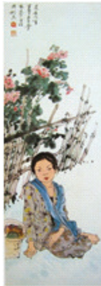
Rupa perempuan menatap kedepan dengan pakaian kebaya dan seldang.