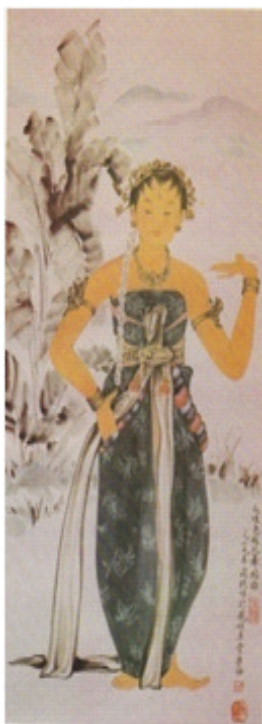
Gambar 8 Chiang Yu Tie. Tari Serimpi. Cat air di atas kertas

Adapun objek karya seni lukis seperti dapat dilihat pada gambar 7 memperlihatkan seorang wanita yang sedang menari, gestur tubuhnya menghadap ke arah depan, matanya melirik kesamping, kedua tangannya terangkat, jari tangan kanan memegang kipas yang diarahkan kebawah dan bagian sikunya tertekuk menarikan tari pendet. Kaki kanannya terangkat dengan bagian telapak kaki mengarah ke samping dengan jempol yang terangkat mengikuti irama tariannya. Pada bagian kepala tampak penutup kepala khas mirip dengan ikat bali, kedua telinganya diselip bunga kamboja. Aksesoris yang dipergunakan pada bagian leher dan lengan atas. Pakaianya khas Bali berupa