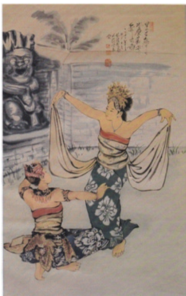
Gambar 9 Tari Gembira Dua Orang Bali. Cat air di atas kertas

Objek karya seni lukis pada gambar 9 memperlihatkan sepasang penari, perempuan dan laki-laki yang sedang menari. Penari wanita gestur tubuhnya menghadap ke arah samping menghadap ke