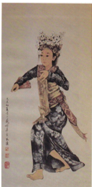
Gambar 6. Chiang Yu Tie. Tari Kipas Bali. Cat air di atas kertas.

Objek karya seni lukis (gambar 6) memperlihatkan seorang wanita yang sedang menari, gestur tubuhnya menghadap ke arah samping kanan, kedua tangannya meliukkan tarian yang sedang ditarikannya, sedangkan kakinya tertekuk mengikuti irama tarian. Pada bagian kepala tampak penutup kepala khas untuk menarikan tari Bali dipenuhi dengan bunga kamboja putih. Pakaian tari yang dipergunakan mengidentifikasi berasal dari Bali lengkap dengan selendang, setagen serta jarit Bali yang bermotif. Di bagian belakang lukisan dibiarkan kosong, seniman secara sengaja membiarkan isi dan kosong pada lukisan ini untuk berbicara kepada pemirsa. Figur perempuan menjadi vocal of point dalam karya seni lukis ini, sekaligus menjadi objek tunggal pada lukisan. Seniman memang ingin menonjolkan karakteristik lokal pada lukisannya yang dibuat dengan teknik me-