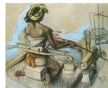
Rupa perempuan membelakangi pemirsa karena sedang bekerja mempersiapkan alat tenun dengan kemben dan kain panjang.