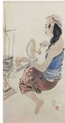
Rupa perempuan sedang memutar alat pemintal benang dengan kemben dan kain panjang.