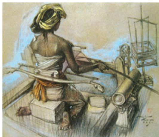
Gambar 4. Lee Man Fong, Gadis Bali sedang menenun, konte dan pastel diatas kertas, 46 cm X 53 cm-koleksi Bung Karno.

Objek dengan figur perempuan seperti dapat dilihat pada gambar 4 menampilkan pose yang membelakangi pemirsa sambil duduk di dingklik (tempat duduk pendek