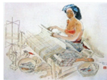
Rupa perempuan sedang menenun dengan kemben dan kain panjang.