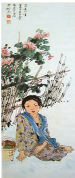
Gambar 1. Lee Man Fong, Anak perempuan Jawa, cat air dan tinta bak di atas kertas, 34,5cm X 97cm, Th 1959-koleksi bung karno.

Objek karya seni lukis pada gambar 1 memperlihatkan seorang wanita yang duduk termenung dengan sebuah bakul di sisi sebelah kanannya. Di bagian belakang lukisan terdapat objek bunga di balik pagar bambu. Kelopak bunga diberi warna merah muda dengan benang putik berwarna kuning seolah mengindika-