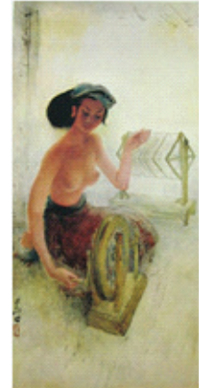
Rupa perempuan dengan dada terbuka dan kain panjang.

Rupa perempuan yang dilukis oleh Lee Man Fong adalah pengamatannya dari lingkungan di mana dia tinggal. Periode tahun 1950-an adalah saat ia tinggal di Bali, di mana perempuan mendominasi dalam kehidupan pria dalam mencari nafkah.