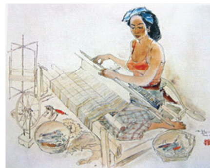
Gambar 2. Lee Man Fong, Wanita Bali Meneun, Cat air dan tinta diatas kertas, 61cm X 60 cm, Th. 1958-koleksi Bung Karno.

Pada karya gambar 2 terdapat dua sumber yang berbeda dengan gambar yang nyaris sama tetapi arah duduk yang berbeda, maka diputuskan oleh penulis un-