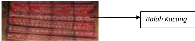
Gambar 8. Kain Tenun Songket “Sisampiang”

membuka diri hendaklah memperlihatkan niat yang baik tanpa menyombongkan diri dengan menunjukkan kemampuan ataupun kekayaan yang dimiliki.