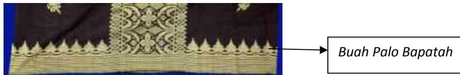
Gambar 4. Kain Tenun Songket “ Sisampiang ”

Pala ( Palo bhs. Minang) dikenal sebagai bahan rempah-rempah yang banyak manfaatnya, baik untuk bumbu penyedap masakan maupun sebagai bahan dasar untuk obat-obatan. Jika buah pala dipatahkan (dibelah) menjadi dua, akan menampilkan isi yang menyerupai ragam hias yang bagus dan indah.