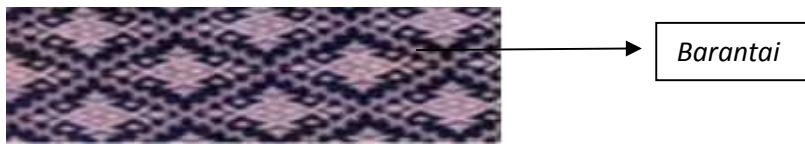
Gambar 6. Kain Tenun Songket “Sisampiang”

Motif barantai disebut, barantai merah dan barantai putih. Ini melambangkan persatuan yang tidak boleh putus-putus antara dua makhluk Tuhan Laki-laki dan wanita.