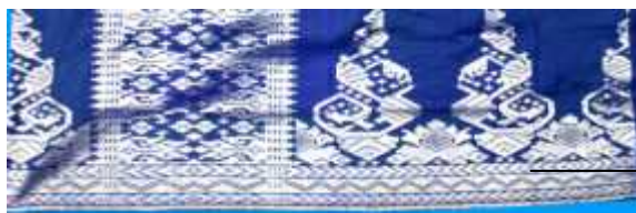
Motif Bada Mudiak

Dalam paparan selanjutnya dapat dikatakan, bahwa “ Bada Mudiak ” sejenis ikan teri yang banyak hidup di laut bahagian pinggir pantai. Kehidupan ikan teri ini sangat banyak menarik perhatian manusia, sehingga orang Silungkang mengambil perumpamaan pada tingkah laku yang harus diperhatikan manusia. Ikan teri ini hidup berkelompok dan seia sekata. Hal ini dapat dilihat dari kata adat sebagai berikut; ibarat “ Bada mudiak ka hulu sarombongan ” (ikan teri serombongan kehulu), “ Buruang Punai tabang sakawan ” (bagai burung punai terbang sekawan). Perumpamaan ini menggambarkan kehidupan yang rukun dan damai seia sekata.