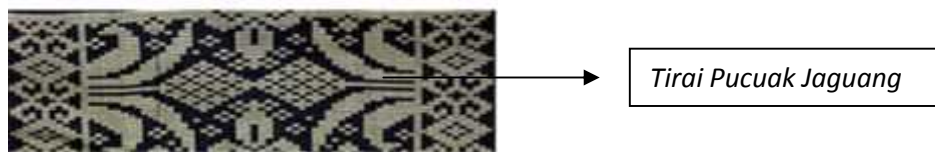
Gambar 7. Kain Tenun Songket “Sisampiang”

Jika buah jagung mulai mekar, maka pada ujung jagung tumbuhlah serabut-serabut yang halus dan banyak. Serabut ini adakalanya menjulai kebawah. Bentuk-bentuk ini memberi inspirasi kepada penenun untuk diterapkan pada motif tenun yang simbolisnya adalah; padi masak jagung maupiah atau padi masak jagung berbuah banyak. Jadi tentang jagung ini dapat pula di jadikan sebagai nilai simboliknya salah satu lambang kemakmuran.