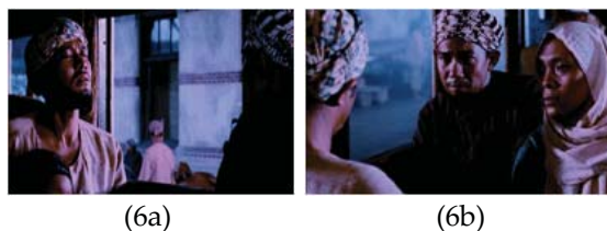
(6a) (6b) Gambar 6 (a, b): Keputusan dan dukungan keluarga

Dari visualisasi rangkaian scene demikian, dapat dipahami bahwa penyandingan cahaya terang-gelap demikian pada dasarnya merupakan upaya sutradara memasangkakan rasionalitas (modern) dan naluri mistis (tradisi). Terang adalah indeks dari