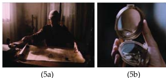
(5a) (5b) Gambar 5 (a, b): Merubah kiblat

Dahlan mulai terusik dengan arah kiblat yang diacu di mesjid-mesjid di Kauman. Setelah mempelajarinya, ia pun mengusulkan perubahan arah kiblat. Namun usulan ini malah dianggap menyesatkan sebab dalam menentukan arah kiblat Dahlan menggunakan peta dan kompas, yang dianggap buatan kafir.