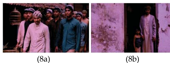
Gambar 8 (a, b): Penyelesaian konflik dan peresmian Muhammadiyah

Upaya eksekusi aspek rasionalitas demikian juga tampak pada ekspos beberapa ikon alat kedokteran, obat-obatan, buku, dsb seperti tampak pada scene 7c, 7d, dan 7e. Pengha-