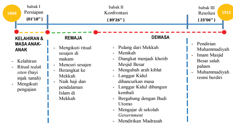
Gambar 1 struktur alur dan plot point film Sang Pencerah

saat kelahiran, peristiwa ketika remaja, dan peristiwa ketika dewasa. Tiap bagian peristiwa ini memiliki kumpulan inti cerita ( plot point ) dan perannya masing-masing dalam keseluruhan alur cerita.