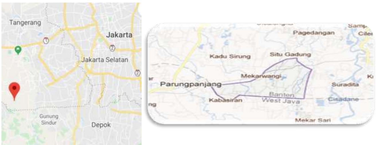
Gambar 2. Peta Desa Mekarwangi, Cisauk-Tangerang

Desa Mekarwangi merupakan salah satu desa yang terpencil berlokasi di Kecamatan Cisauk, Kabupaten Tangerang. Desa yang merupakan desa pemekaran dari Kelurahan Cisauk ini sebagaimana ditunjukkan dalam Gambar 2.