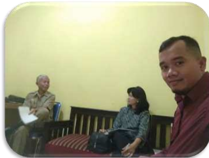
Gambar 3. Proses Peninjauan Kebutuhan Bersama PKM

Berdasarkan hasil peninjauan kebutuhan bersama yang dilakukan pada tanggal 13 Agustus 2019 bertempat di Desa Mekarwangi antara LPPM dan Dosen Akuntansi Universitas Matana dengan Sekretaris Desa Mekarwangi diperoleh keputusan kebutuhan pendampingan akuntansi tahap 1 dilaksanakan di dua Posyandu Desa Mekarwangi yakni Posyandu Rambutan dan Posyandu Nusa Indah. Proses peninjauan kebutuhan bersama sebagaimana dijelaskan pada Gambar 3.