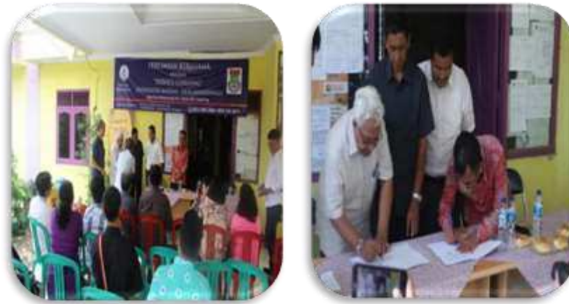
Gambar 1. MoU Universitas Matana-Desa Binaan

Adapun kegiatan rutin yang sudah dilakukan, khususnya di Program Studi Akuntansi, di antaranya adalah pembelajaran akuntansi dasar di SDN Mekarwangi, Cisauk, Kab. Tangerang (Effendi, 2018), pendampingan akuntansi Bendahara dan Pengajar SDN Mekarwangi, Cisauk, Kab. Tangerang (Effendi, 2018) dan kegiatan di tahun 2019 ini yang sedang berjalan adalah pendampingan pembukuan P2WKSS Cilegong Khususnya di Seluruh Posyandu Se-Desa Mekarwangi. Selain kegiatan rutin, terdapat juga kegiatan yang bersifat insidental yang sudah dilakukan seperti bimbingan dan pelatihan akuntansi dan pajak untuk siswa kelas XII Ak di SMK Dharma Widya, Neglasari, Tangerang-Banten (Effendi, 2018).