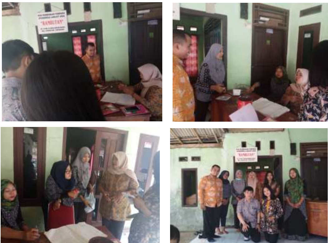
Gambar 5. Proses Edukasi dan Pendampingan Akuntansi Posyandu Rambutan (Kp. Pasir Awi, Rt. 14/05, Ds. Mekarwangi, Kec. Cisauk)

Kegiatan pengabdian kepada masyarakat melalui kegiatan edukasi dan pendampingan akuntansi di Posyandu Rambutan dan Posyandu Nusa Indah ini dilakukan melalui kegiatan pendampingan terkait dengan proses pencatatan pembukuan (akuntansi) Posyandu dari mulai proses pendataan peserta Posyandu hingga proses pelaporan baik terkait informasi keuangan dan informasi non keuangan ke Puskesmas dan Desa Mekarwangi. Tujuan dari kegiatan pendampingan dalam Posyandu ini adalah untuk meningkatkan pemahaman memadai mengenai pembukuan (akuntansi) bagi Para Kader Posyandu dalam proses pencatatan dan pembukuan yang efektif dan efisien. Selanjutnya, kegiatan pendampingan ini juga bertujuan untuk meningkatkan kecepatan dan keakuratan pelaporan pembukuan bagi Para Kader Posyandu baik informasi keuangan maupun non keuangan untuk pihak internal dan pihak eksternal.