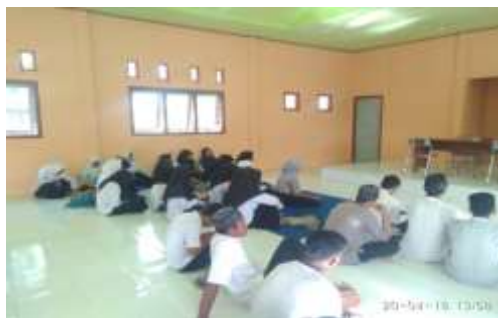
Gambar.1: Kegiatan belajar mengajar

Pengajaran di sekolah Desa Lifofa dilakukan sesuai dengan basis keilmuan. Tahapan dan tahapan awal mengajar pada tanggal 23 Maret - 13 Mei 2018 di semua kelas mulai pukul 08:00-12.00 untuk SD dan SMP dan SMA disesuaikan dengan Mata pelajaran yang diberikan yaitu Matematika, Biologi, PAI, PPKN, Kerajinan Tangan dan Akhlaq.