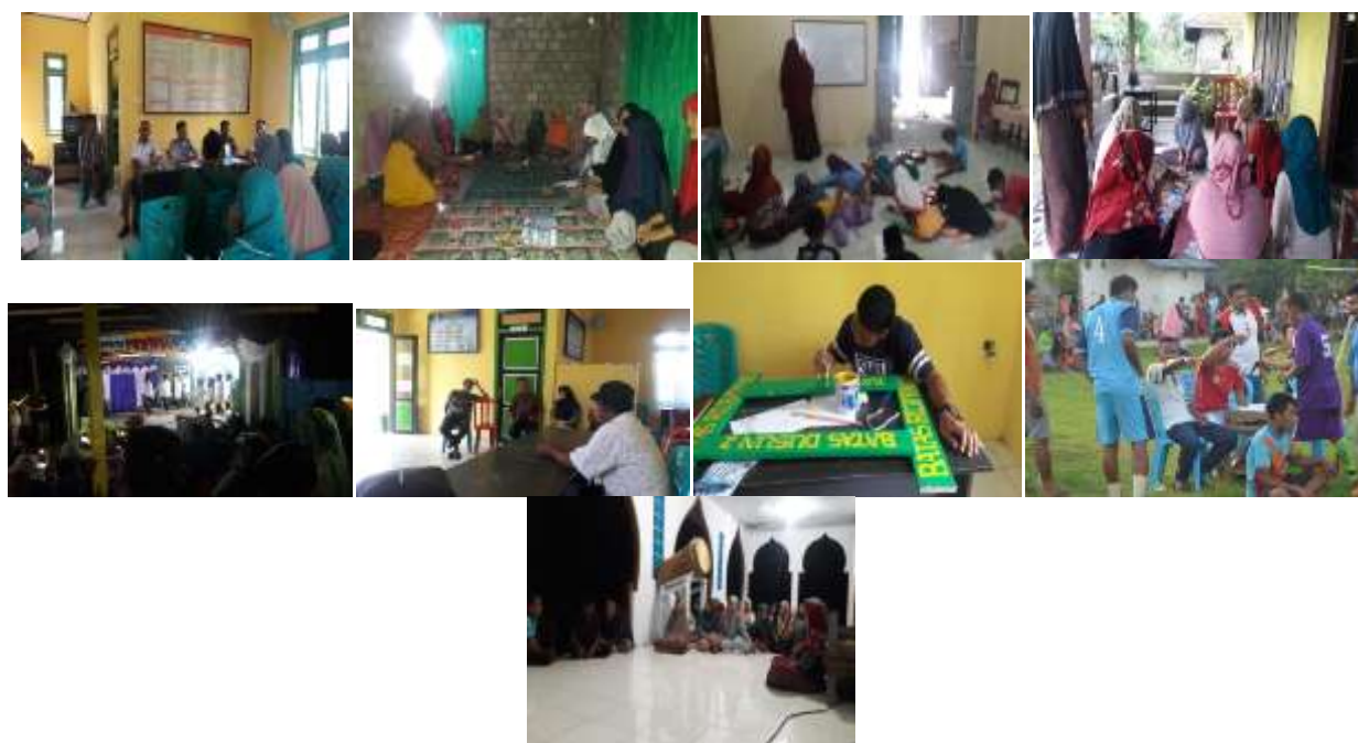
Gambar, 2: Potret kegiatan pengabdian yang sedang berlangsung