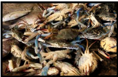
Gambar 6. Rajungan rusak ringan

Kriteria dalam rajungan utuh biasanya warna rajungan segar berwarna