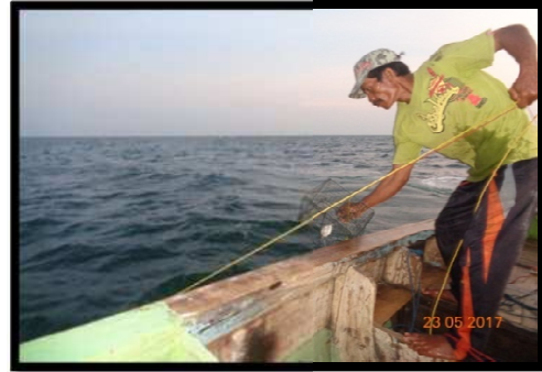
Gambar 4. Pengangkatan hasil tangkapan

lahan. Selanjutnya ikan tangkapan bubu langsung dilepaskan satu per satu dan dimasukkan ke dalam keranjang. Hasil tangkapan yang didapat berupa rajungan, keong, udang alam, ikan dan balakutak.