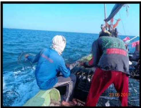
Gambar 3. Proses perendaman alat tangkap bubu

Bubu didaerah Gebang dalam proses immersing sama seperti didaerah lainya yaitu mengalami proses perendaman dengan membiarkan bubu berada di dalam air ( immersing ). Immersing dilakukan selama 4 jam.