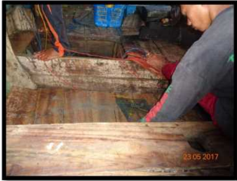
Gambar 2. Penurunan alat tangkap

Operasi penangkapan dilakukan pada dini hari pukul 05.00, sampai difishing ground pukul 07.00 setelah itu perahu mulai maju perlahan-lahan untuk menurunkan bubu lipat. Setting dilakukan selama 2 jam sampai 3 jam. Setting yang dilakukan selama 1 kali.