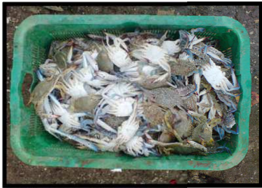
Gambar 5. Rajungan Utuh

Gambar 5 dan Gambar 6 dibawah menunjukkan kerusakan fisik rajungan diantaranya rajungan utuh, rajungan rusak ringan.