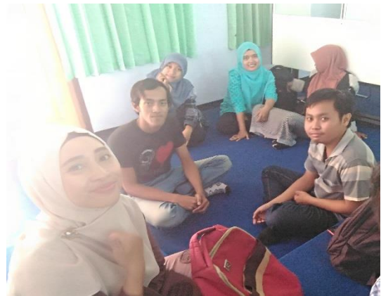
Gambar 6. Proses Pendampingan