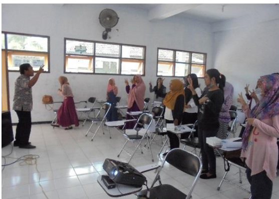
Gambar 5. Proses Praktikum