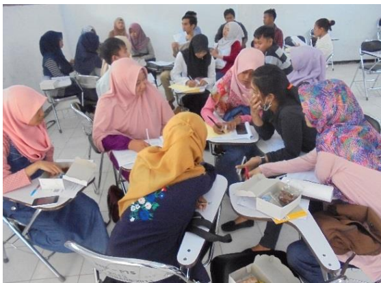
Gambar 4. Proses Diskusi

Tujuan kegiatan ini adalah membantu para peserta pelatihan untuk membuat PTK dan memberi saran yang dibutuhkan dalam proses penyelesaiannya. Namun sayangnya, selama tahap ini, tidak ada peserta yang datang untuk berkonsultasi untuk mendiskusikan PTKnya. Beberapa peserta hanya mengungkapkan jika sensitifitas mereka tentang masalah dalam kelas mulai bertambah. Mereka juga lebih paham tentang manfaat dan fungsi PTK.