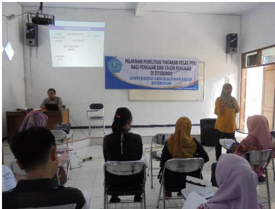
Gambar 3. Pemberian Materi

Tujuan kegiatan ini adalah membantu para peserta pelatihan untuk membuat PTK dan memberi saran yang dibutuhkan dalam proses penyelesaiannya. Namun sayangnya, selama tahap ini, tidak ada peserta yang datang untuk berkonsultasi untuk mendiskusikan PTKnya. Beberapa peserta hanya mengungkapkan jika sensitifitas mereka tentang masalah dalam kelas mulai bertambah. Mereka juga lebih paham tentang manfaat dan fungsi PTK.