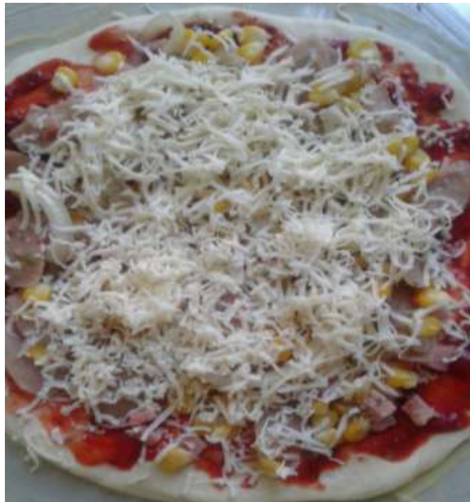
Gambar 3. Hasil produk pelatihan

Hasil pizza yang telah diolah akan seperti berikut :