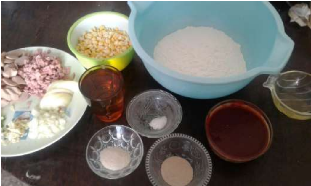
Gambar 2. Bahan-bahan Pizza