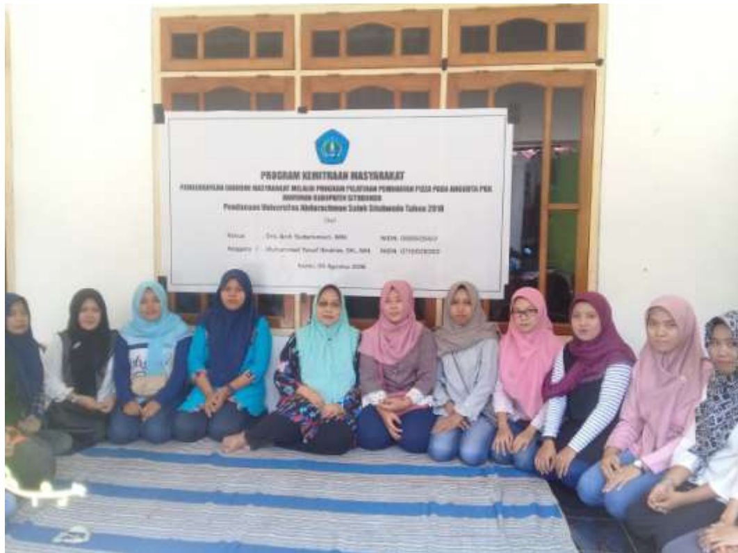
Gambar 1. Foto Bersama dengan Anggota PKK Dawuhan

Pelaksanaan kegiatan pelatihan pembuatan Pizza ini diikuti oleh 10 anggota PKK aktif dengan pokok bahasan dan pelatihan meliputi :