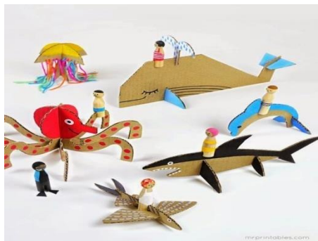
Gambar 2. Binatang laut dari Kardus Bekas dengan kombinasi Warna

Selain dari kardus alami, produk APE juga bisa dibuat dengan mengkombinasikan kertas warna ataupun menggunakan cat, produk yang dihasilkan juga lebih unik dan berkesan hidup, berikut dapat dilihat pada gambar :