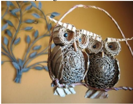
Gambar 1. Boneka Owl / burung hantu dari kardus bekas

Para ibu-ibu wali murid sangat bersemangat mengikuti kegiatan ini. Disamping beberapa produk APE yang diajarkan sangat mudah juga produk yang dihasilkan sangat unik, kegiatan ini tentu mengundang rasa tertarik ibu-ibu bagaimana menciptakan produk tersebut agar bisa dijual di pasar. Kegiatan pelatihan di hari pertama ini difokuskan agar para ibu-ibu bisa membuat produk ini hingga siap untuk di jual. Mulai dari pengolahan bahan hingga menghasilkan bentuk APE yang unik seperti model owl (burung hantu) ikan, gantungan kunci dan lain-lain. dibawah ini ilustrasi hasil pembuatan produk APE dari koran dan kardus bekas pada gambar berikut :