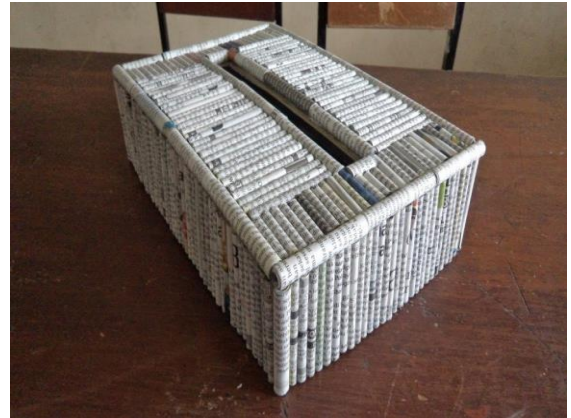
Gambar 3. Kobinasi Kardus dan Koran Bekas menjadi tempat tisu

produk yang dihasilkan lebih unik karena tingkat kreatifitas yang tinggi dan mamapu menciptakan bentuk-bentuk yang lebih banyak, hasilnya bisa dilihat pada gambar 5.3 berikut :