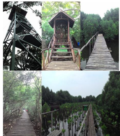
Gambar 4. Menara pandang

Karena Hutan Mangrove ini cukup luas, bagi yang pertama kali datang ke sini, ada baiknya naik menara pandang dahulu untuk mengetahui prioritas tempat yang bagus untuk dinikmati.