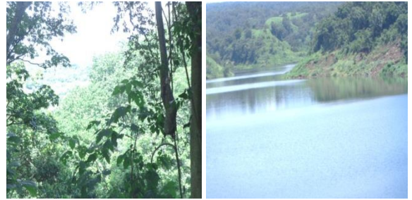
Gambar 6. Pemandangan Ngarai Curah Tangis

Wisata Ngarai Curah Tangis ini merupakan salah satu tempat wisata yang memiliki pemandangan yang sangat indah yaitu berupa ngarai dengan jurang yang dalam. Lokasi curah ini terletak antara Gunung Baluran, Waduk Bajulmati dan Perkebunan Pasewaran.