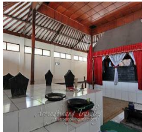
Gambar 10. Makam Keramat Candibang

Di desa Wonorejo ada makam kuno Candibang dekan pantai yang selalu dikunjungi oleh wisatawan religi pada saat menjelang bulan puasa Ramadhan. Tentu akan menjadi obyek wisata pendukung taman nasional Baluran.