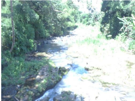
Gambar 8. Arum jeram Wonorejo

Tempat ini dapat menjadi obyek wisata di Wonorejo yang dapat difungsikan menjadi area arum jeram mulai dari waduk sampai dengan jembatan di perbatasan Kabupaten Situbondo dan Kabupaten Banyuwangi.