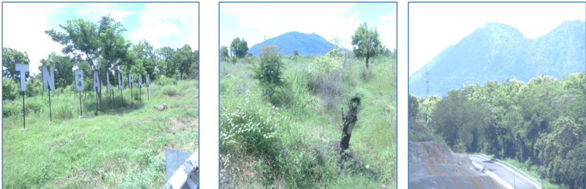
Gambar 11. Taman Nasional Baluran (TBN)

berkeluaran diatas pohon, merak yang berlari dengan untaian ekor panjang dan banteng yang berkubangan di kolam air yang bercampur lumpur.