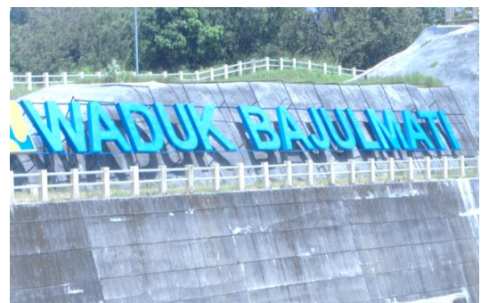
Gambar 7. Waduk Bajulmati

Waduk yang baru diresmikan ini menjadi tempat wisata. Waduk ini juga dibangun untuk mengairi 1800 hektar sawah, kolam pancing ikan, dan juga sebagai pembangkit listrik bagi masyarakat sekitar.