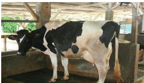
Gambar 9. Agrowisata sapi perah

Kabupaten Situbondo merupakan salah satu kabupaten dengan jumlah sapi terbanyak dan terkenal dengan sapi Limosin. Untuk menambah wawasan tentang budidaya sapi, maka perlu dikembangkan sebuah agrowisata di Desa Wonorejo ini. Di Agrowisata ini pengunjung dapat melihat langsung proses budidaya sapi Lomosin dari mulai pemberian pakan, manajemen kandang. Aktifitas ini bisa memancing pengunjung untuk datang ke Wonorejo, karena dapat menambah pengalaman tersendiri.