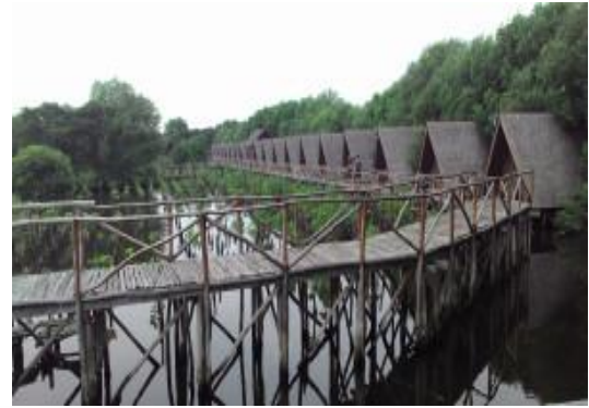
Gambar 2. Pemandangan hutan mangrove