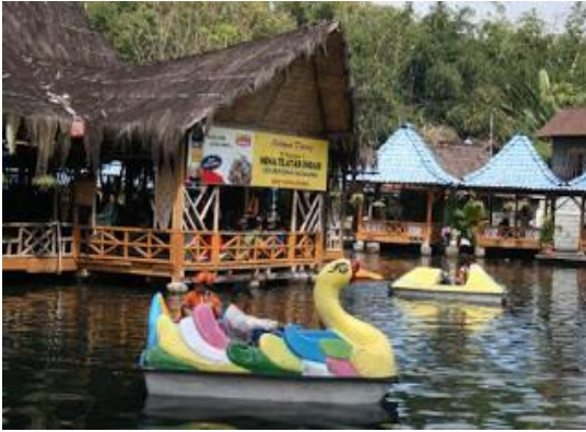
Gambar 5. Wisata pemandian

melakukan kegiatan tertentu baik syukuran, ulang tahun, komunitas, reuni dll.