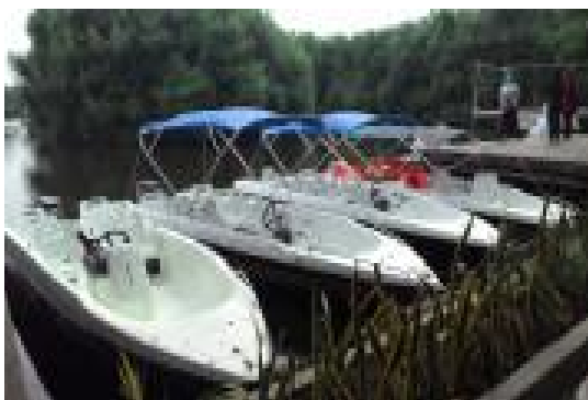
Gambar 3. Perahu wisata air

Tempat Wisata di Situbondo yang perlu anda tahu, Tempat wisata terindah dan memiliki potensi pariwisata yang cukup banyak, namun memang keberadaannya kurang terekspos sehingga kurang diminati oleh wisatawan. Hal itu menyebabkan pengunjung tempat wisata di Kabupaten Situbondo didominasi oleh wisatawan lokal saja. Selibuhnya mereka biasanya lebih tertarik berkunjung ke tempat wisata yang ada di Banyuwangi.