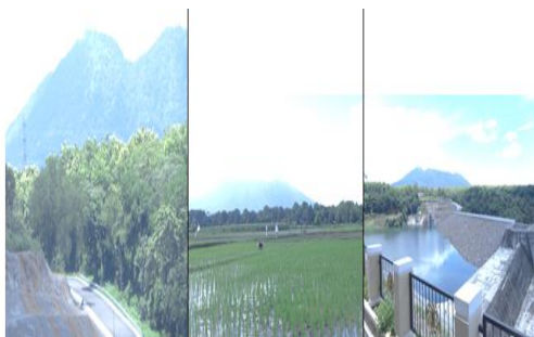
Gambar 6. Pemandangan gunung baluran

Gunung Baluran merupakan buah gunung yang terletak antara taman nasional Baluran dengan Waduk Bajulmati. Di kawasan ini terdapat perlu rintisan pendakian gunung, walaupun hanya jalan setapak. Di puncak gunung direkayasa mendirikan bangunan menara pandang, yang dapat melihat gunung Ijen, pantai Bama, kawasan persawahan Wonorejo dan Wongsorejo. Dan diselatan ada ngarai curah tangis, waduk Bajulmati dan kawasan perkebunan Pasewaran. Jika mendaki ke gunung Baluran, maka akan mendapati pemandangan yang sangat indah.