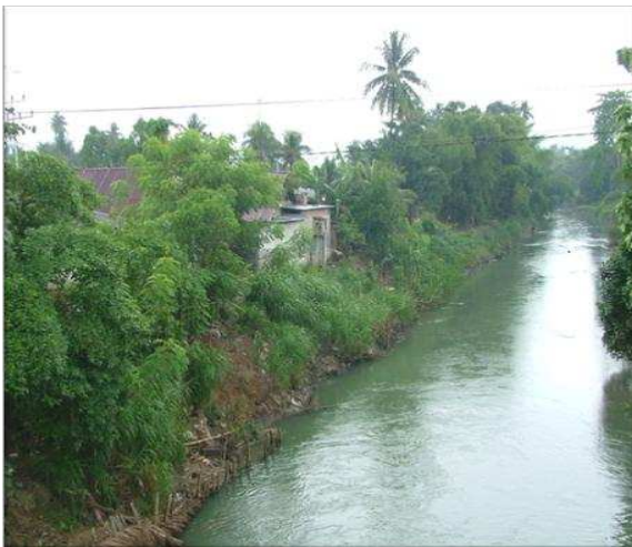
Gambar 2. Lokasi Sungai Bolango

lokasi sungai Bolango dapat dilihat pada Gambar 2 di bawah ini :