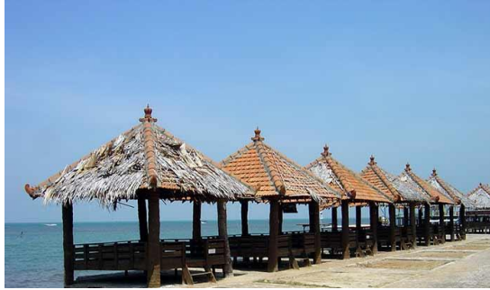
Gambar 4. Gazebo di sepanjang pesisir pantai

laut, seperti cumi-cumi, cakalang, layur, dan lainnya, kerang laut, dan berbagai jenis terumbu karang.