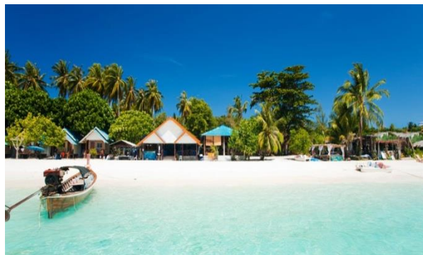
Gambar 6. Lokasi Pantai Pattaya

Pattaya adalah salah satu tujuan wisata utama ketika berkunjung ke Bangkok. Kota Pattaya dapat ditempuh hanya dalam waktu 1 jam 30 menit