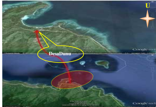
Gambar 2. Peta Udara Lokasi Pantai Dunu Kec. Monano Kab. Gorontalo Utara

Desa Dunu terbagi atas 3 dusun yaitu Dusun Dinuke, Dusun Mutiara dan Dusun Molosifat. Desa Dunu sampai tahun 2014 dihuni oleh 645 jiwa yang terbagi pada 168 Kepala keluarga.