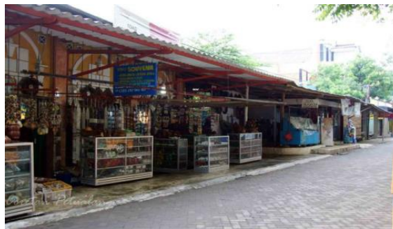
Gambar 5. Pusat Penjualan Soufenir

dijangkau. Tepatnya terletak di Desa Bulu, Kecamatan Jepara, Kabupaten Jepara, Provinsi Jawa Tengah.