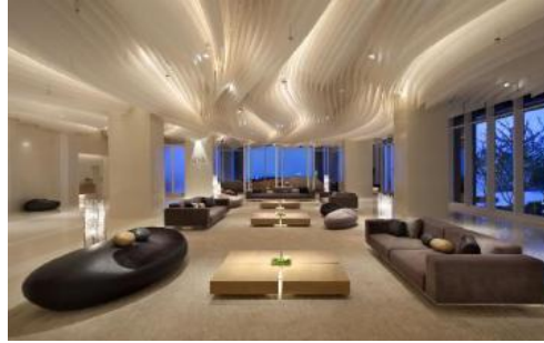
Gambar 9. Desain Interior hotel dengan konsep teknologi

Pada malam hari, meninggalkan aksent pencahayaan dari atas pola kain linear. Seluruh volume langit-