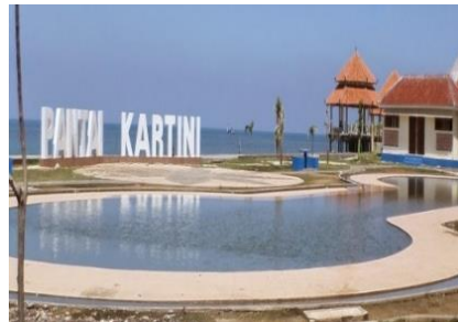
Gambar 3. Kawasan Wisata Pantai Kartini

Objek Wisata Pantai Kartini Rembang adalah pantai yang bersih, kualitas air yang jernih, ombak yang relatif kecil,