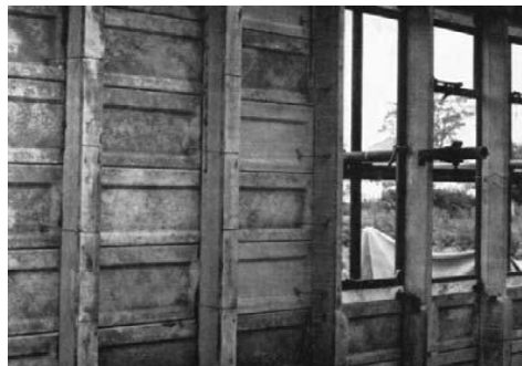
Foto ini menunjukkan rumah Airey selama konstruksi. Cladding eksternal terikat pada kolom dengan kawat tembaga twisted. Kayu

melalui Cacat Perumahan Act 1984 ; dana hanya tersedia bagi mereka yang telah membeli rumah mereka.