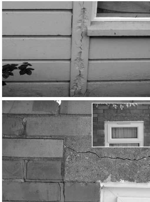
Dua contoh karbonasi Pada Rumah Cornish , satu di palang beton dan satu di kolom bantalan beban.

Dalam penampilan, komponen yang terkena dampak akan cenderung menunjukkan retak memanjang di sepanjang garis setiap tulangan baja. Tampilan awal akan berupa retak garis rambut, yang dapat terjadi sedini beberapa bulan setelah konstruksi. Seiring waktu, perluasan hasil baja berkarat dalam kolom retak sepanjang panjangnya, serta spalling dari permukaan beton. Kehadiran karbonasi dapat ditentukan oleh pengujian di situ beton. Indikator kimia (hidroksida mangan atau larutan fenolftalein) diterapkan pada permukaan area yang dicurigai dan akan menunjukkan baik sejauh dan kedalaman dari serangan apapun. Penentuan efek pada baja kemudian diperlukan. Adalah normal untuk mengasumsikan bahwa tingkat saat karbonasi akan berlanjut dan, setelah mencapai baja, retak korosi dan longitudinal akan dimulai segera.