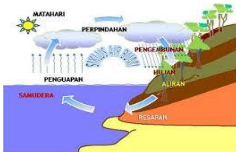
Gambar 2.1 Siklus Hidrologi

Sumber air baku tersebut yang diatas ini mempunyai hubungan antara satu sama lain yang merupakan satu mata rantai yang tidak dapat diputuskan lagi yang disebut daur hidrologi. Pada dasarnya banyaknya jumlah air di alam ini adalah tetap hanya saja berputar-putar mengikuti siklus hidrologi tersebut. Siklus hidrologi dapat dilihat pada gambaran srbagai berikut: