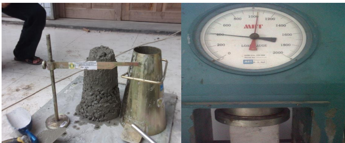
Gambar 1 . Hasil pengujian nilai slump dan kuat tekan