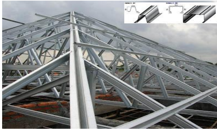
Gambar 1. Rangka Atap Baja Ringan

Kusen jendela dan pintu juga sudah mulai menggunakan bahan aluminium sebagai generasi bahan bangunan masa datang. Hal ini dikarenakan bahan aluminium memiliki keunggulan dapat didaur ulang, bebas racun dan zat pemicu kanker, bebas perawatan dan praktis (sesuai gaya hidup modern), dengan desain insulasi khusus mengurangi transmisi panas dan bising (hemat energi, hemat biaya), lebih kuat, tahan lama, antirarat, diganti hanya karet pengganjal saja, tersedia beragam warna, bentuk, dan ukuran dengan tekstur variasi (klasik, kayu).