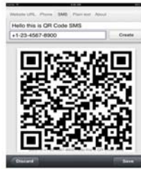
Prototype 2. Aplikasi QrCodereader untuk iLearning