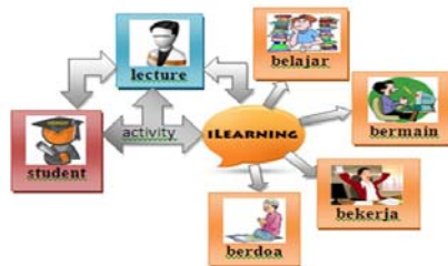
Gambar 1. iLearning Design System

Dari gambar 1 di atas bisa dilihat metode yang menggunakan iLearning ini dapat digunakan dalam kehidupan sehari-hari, aktivitas atau kegiatan yang sering dilakukan. Misalnya saat belajar, saat bermain, saat bekerja, dan saat berdoa yang saling berkaitan.