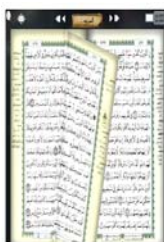
Prototype 5. Aplikasi Al-Qur'an Digital untuk iLearning

Al-qur'an digital adalah software yang berisi database al-Qur'an baik teks ayat-ayat arabnya maupun terjemahan kebahasa lainnya, gambar, maupun suara hasil bacaan ayat-ayatnya. Dengan al-Qur'an Digital para penggunanya dapat mencari apa pun yang berhubungan dengan al-Qur'an secara mudah dan cepat.