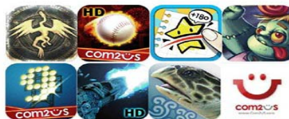
Prototype 6. Aplikasi Game Center untuk iLearning

Game Center merupakan bagian dari bermain atau permainan. Games penting untuk perkembangan otak, untuk meningkatkan konsentrasi dan melatih untuk memecahkan masalah dengan tepat dan cepat.