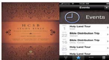
Prototype 4. Aplikasi Bible Digital untuk iLearning