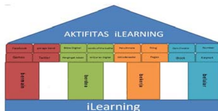
Arsitektur 1. iLearning Arsitektur

Dari arsitektur 1 di atas bisa dilihat aktifitas iLearning ini memiliki banyak aplikasi yang mempermudah proses pembelajaran, yang tidak dapat terpisahkan dalam kehidupan sehari-hari. Aplikasi yang dapat menunjang belajar yaitu iBook, Keynot, Number, Quis Creator. Kemudian bisa juga bekerja aplikasinya adalah Pages, Fring, QrCodereader, Penultimate. Aplikasi yang digunakan untuk berdoa yaitu Bible Digital, World of the Budha, Peningat Adzan, Al-Qur'an Digital. Bermain adalah salah satu bagian dari metode pembelajaran iLearning aplikasi yang menunjang bermain yaitu Facebook, Twitter, Game center, dan Gerage Band.