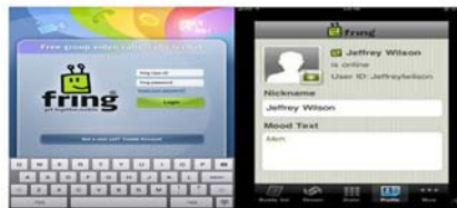
Prototype 3. Aplikasi Fring untuk iLearning

Fring Merupakan aplikasi untuk telepon selular melalui koneksi internet yang berbasis pada web yang mendukung layanan telepon, pengiriman pesan instan yahoo! Messenger, skype, google, facebook, twitter. Kali ini fring meluncurkan aplikasi yang dapat melakukan chat video secara group.