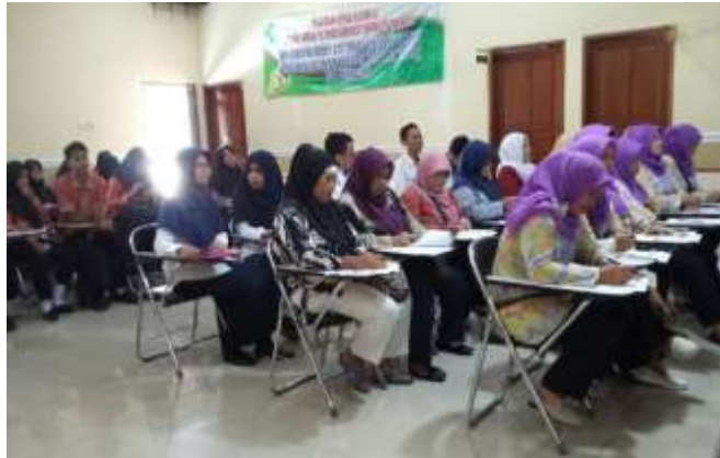
Penyuluhan tentang Produksi Serbuk Minuman Jahe