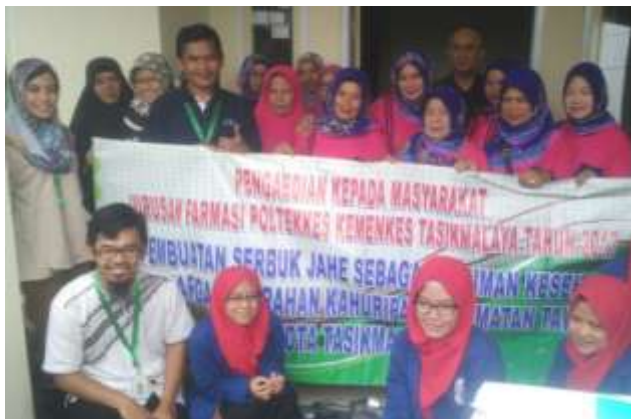
Foto Bersama Warga Binaan Kelurahan Kahuripan Tasikmalaya