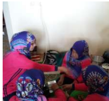
Proses Pembuatan Serbuk Jahe Instan