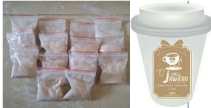
Gambar 2. Produk Serbuk Jahe Instan dan Desain Kemasan Minuman

dilaksanakan berupa penyuluhan umum tentang tanaman obat keluarga (TOGA) khususnya Jahe, pembuatan serbuk jahe, dan sosialisasi sertifikasi Pangan Industri Rumah Tangga (P-IRT). Dalam kegiatan ini dilakukan evaluasi pengetahuan peserta melalui pre-test dan post-test . Praktek langsung pembuatan minuman serbuk jahe dilakukan di salah satu rumah warga yang melibatkan dosen dan mahasiswa Farmasi Politeknik Kesehatan Kemenkes Tasikmalaya.