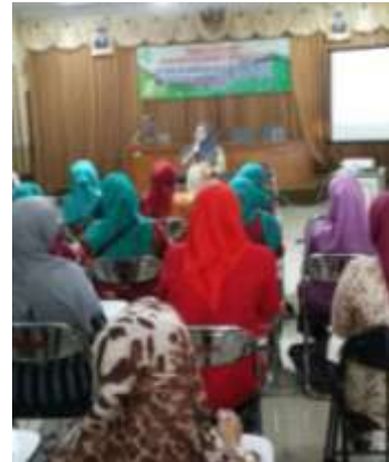
Sosialisasi Sertifikasi Pangan Industri Rumah Tangga